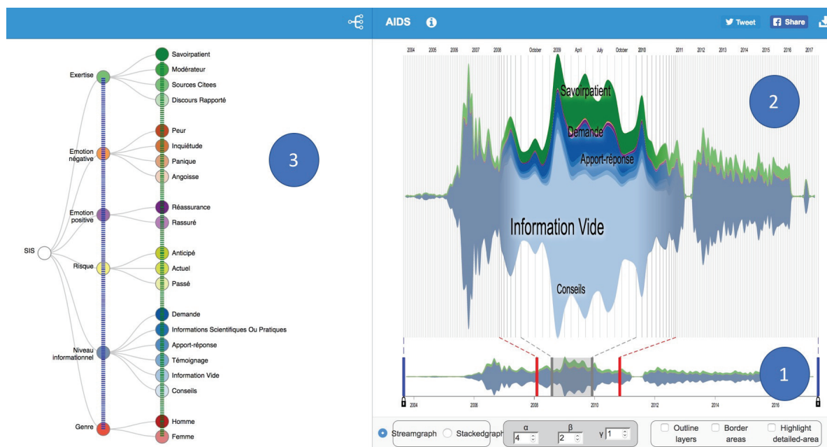
FIGURE 2 – Visualisation des séries temporelles avec un focus sur la période 2008-2011.