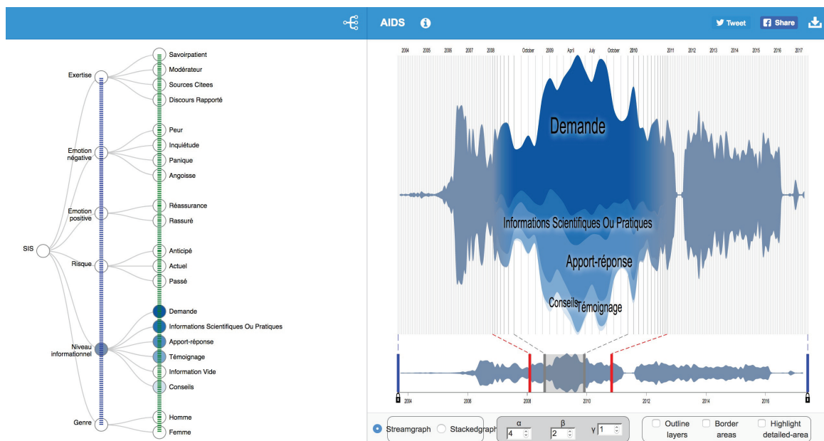
FIGURE 3 – Visualisation de la dimension "Niveau informationnel" dans laquelle les messages relatifs à la classe "Information vide" ont été filtrés grâce à l'arbre d'agrégation.