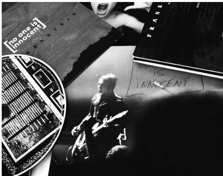
Figure 1 : Quand il ne reste que la guerre pour tuer le silence...