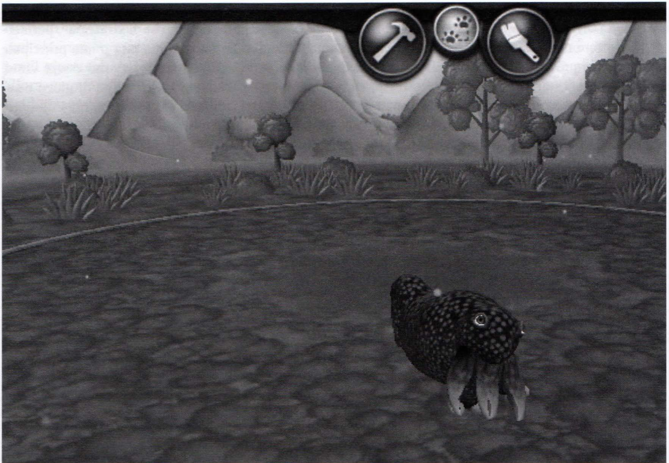
Spore Creature Creator , Will Wright, 2008