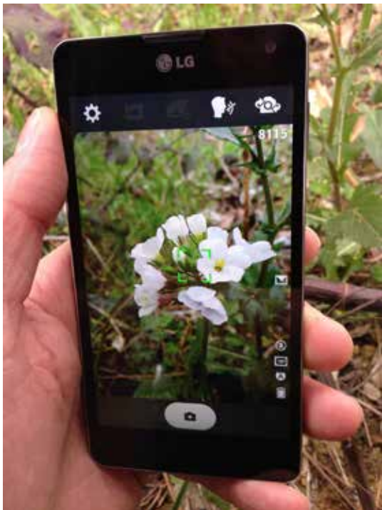
Figure 1 : Acquisition d'une photo de fleur, pour la réalisation d'une requête visuelle à travers l'application Pl@ntNet-mobile (version Android).

En travaillant sur (i) la constitution d'un jeu de données structuré, (ii) le développement d'outils de recherche innovants, (iii) la constitution d'une communauté de volontaires, l'initiative Pl@ntNet a permis l'agrégation d'un volume très important d'observations botaniques (plus de 600 000 observations actuellement en cours d'analyse), issues des requêtes d'identification de la communauté d'utilisateurs. L'infrastructure mise en œuvre a été exploitée par une très vaste typologie d'utilisateurs (de novices à chercheurs confirmés), dans près de 150 pays du monde, par plus de 300 000 personnes. Ce constat permet d'envisager une nouvelle forme de collecte de données botaniques dans le futur, s'appuyant sur des réseaux humains plus diversifiés qu'actuellement, et impliquant notamment un plus grand nombre d'acteurs de la société civile (Joly et al., 2014b).