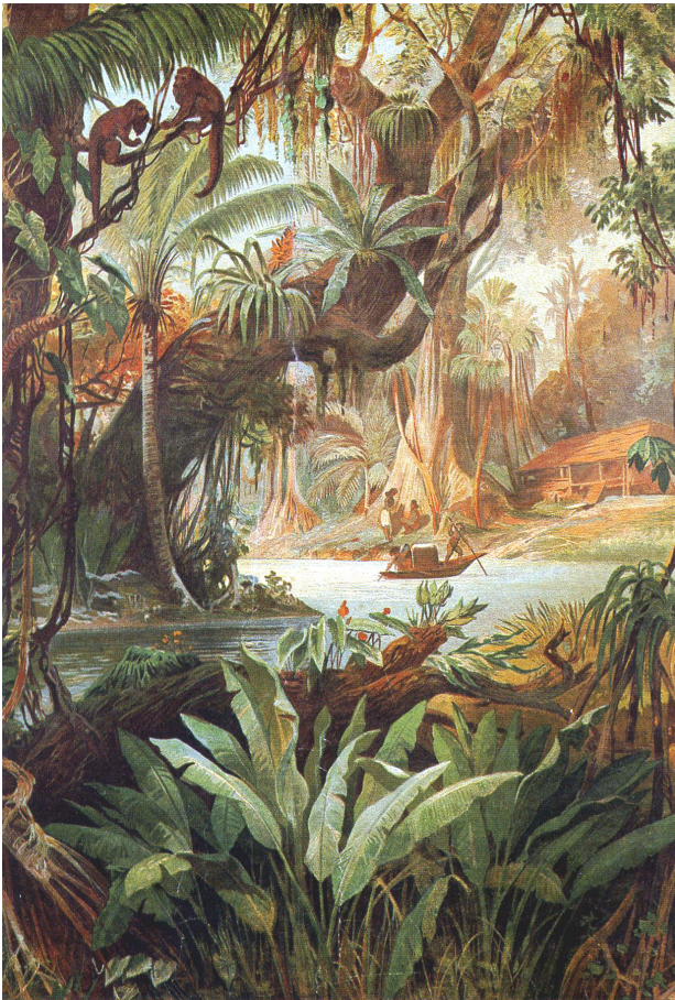
Source : Forêt vierge, lithographie, 1911 in L'Amazone un géant blessé, Coll Découverte Gallimard, 1990

Les explorateurs proposent une relecture scientifique et posent les bases de l'exploitation raisonnée de l'Amazonie