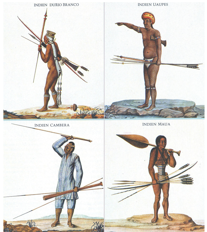
Source : Dessin in Viagem fillosofica, A. Rodriguez Ferreira, Lisbonne, XVIIIe siècle in L'Amazone un géant blessé, Coll Découverte Gallimard, 1990