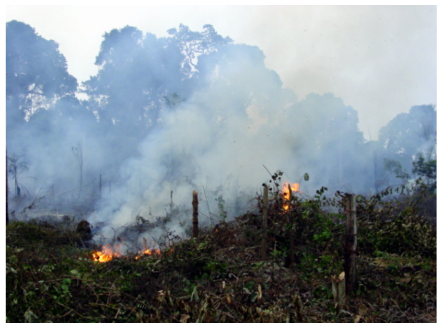
La forêt qui part en fumée pour laisser la place aux pâturages est souvent publiée pour alerter l'opinion publique sur la déforestation.