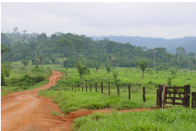
Doit-on voir la forêt qui recule ou les pâturages qui progressent ?