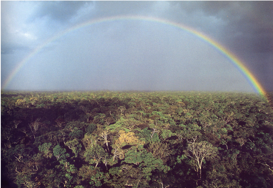
La forêt dans toute sa splendeur : ses mystères et ses richesses.

Un patrimoine mondial de l'Humanité, habité et source de biodiversité d'une part, une terre toujours à conquérir et à soumettre à l'appétit dévoreur des investisseurs d'autre part.