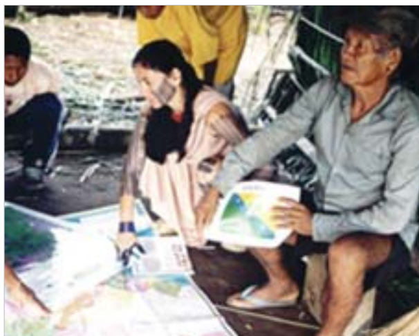
3. Présentation des documents réalisés

Cette même nuit, les Kayapó ont formulé une nouvelle demande : « La carte d'un seul village, ça ne peut pas marcher parce que c'est un mensonge... Ce que nous voulons faire, c'est une carte de notre terre à nous tous, pyka kuni . »