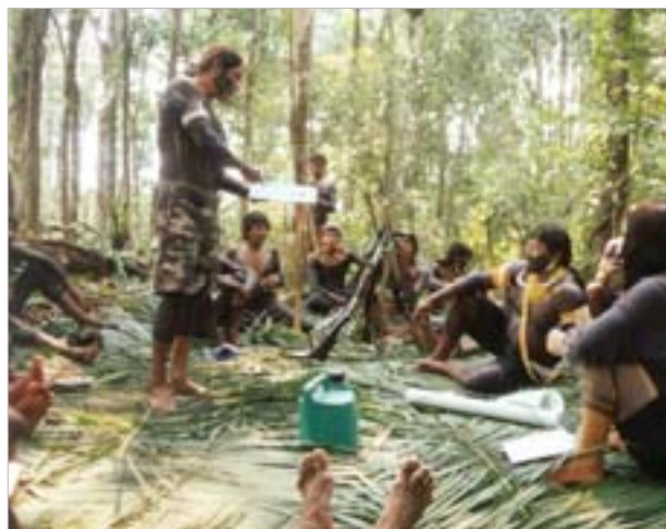
4. Séance de discussion « difficile » autour des cartes

L'élaboration de la carte et de sa légende (en examinant simultanément d'autres exemples de cartes régionales) a suscité des débats animés entre les participants, par exemple sur les thèmes suivants :