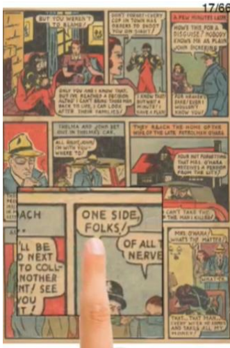
Illustration 1 - Comic Reader Mobi, http://comicreader.mobi/

Ici, l'emboîtement des modèles de lecture est particulièrement exemplaire : en cliquant, le lecteur fait disparaître la planche - elle est masquée en partie par le nouveau cadre qui apparaît - pour la « monumentaliser » dans cet autre cadre de lecture. En fond, la planche devient illustrative ; agrandie, elle est monument. Dans tous les cas, elle est soumise à l'application logicielle de lecture qui rend caduque sa fonction d'hypercadre. Si la planche, réduite à l'essence de la forme prend un nouveau statut, son surdimensionnement modifie également sa qualité d'objet lisible. Sans repères, le lecteur est contraint de déterminer des unités /cadres coïncidant avec l'écran, et de réaliser ainsi dans sa lecture une édition du texte instable et éphémère.