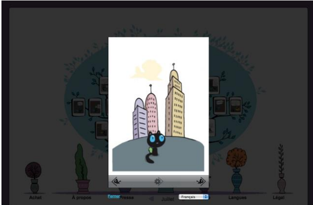
Illustration 7 – Trondheim Lewis, Bludzee , www.bludzee.com , consulté le 30 septembre 2010.

l'ensemble de l'encyclopédie qui lui est associée par les usages sociaux. » 57 . La convocation du cadre de l'écran de smartphone (plus précisément de l'Iphone) s'effectue selon un double registre : d'une part, la forme de l'objet « évoque » l'appareil, en en faisant disparaître la matérialité physique (épaisseur, coque et bouton). En cela, le reformatage d'une couverture d'album papier est représentative d'une hybridation des valeurs symboliques associées à ces deux matérialités éditoriales. Le lecteur repère là un contenu, et son format (d'ailleurs en incohérence avec la formulation « disponible sur le web »). Les bords de l'Iphone symbolisent la publication numérique en général, mobilisant ainsi les valeurs d'innovation et d'affectivité qui sont associées à ce smartphone en particulier, qui est cité abondamment par les autres industriels. D'autre part, le second registre relève de l'évocation du cadre de lecture comme support du texte. Bludzee est mis en page sur le site internet éponyme par la délimitation d'un cadre dans le cadre de l'écran, en surbrillance.