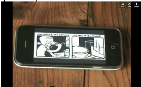
Illustration 2- Test Application BD ANGOULEME 2009 sur iPhone, http://www.dailymotion.com/video/x7oc7c_test-application-bd-angouleme-2009_school

Le défilement des cases proposé par AveComics est une négation pensée de la planche 40 . Ce mode associe alors étroitement de récit et la succession des cases, en assumant la perte de la planche dans la lecture. Le lecteur fait défiler les cases comme les pages d'un livre, dissociées de leur « organisme » qu'est la planche 41 .