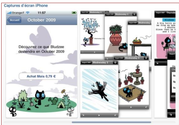
Illustration 5 - iTunes, Bludzee par AveComics Production, http://itunes.apple.com/fr/app/bludzee/id324276543?mt=8

Bludzee est désigné comme strip dans les présentations qui en sont faites : on est pourtant bien loin de la bande, qui permet une vision globale du récit. Les effets de miroirs entre la première et la dernière case, les répétitions entre les cases s'effectuent ici seulement dans la lecture 52 . Le lecteur doit, avec l'écran tactile, faire défiler - au sens propre - les cases, en les déplaçant avec le doigt. Bien que renvoyant initialement au feuilletage, ce mouvement imite plus précisément la manipulation de cartes à jouer, c'est-à-dire d'une forme sans verso.