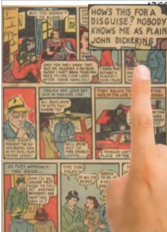
Illustration 3- Comic Reader Mobi, http://comicreader.mobi/

En contrepoint, le zoom du mode Comic reader Mobi permettant d'agrandir les ballons et d'en rendre le texte lisible, constitue un modèle de lecture principalement textuel 42 . Dans l'exemple ci-dessous, le visage de la locutrice au téléphone disparaît derrière ses propres mots. La case est ainsi oubliée, au profit de la planche et de la narration textuelle.