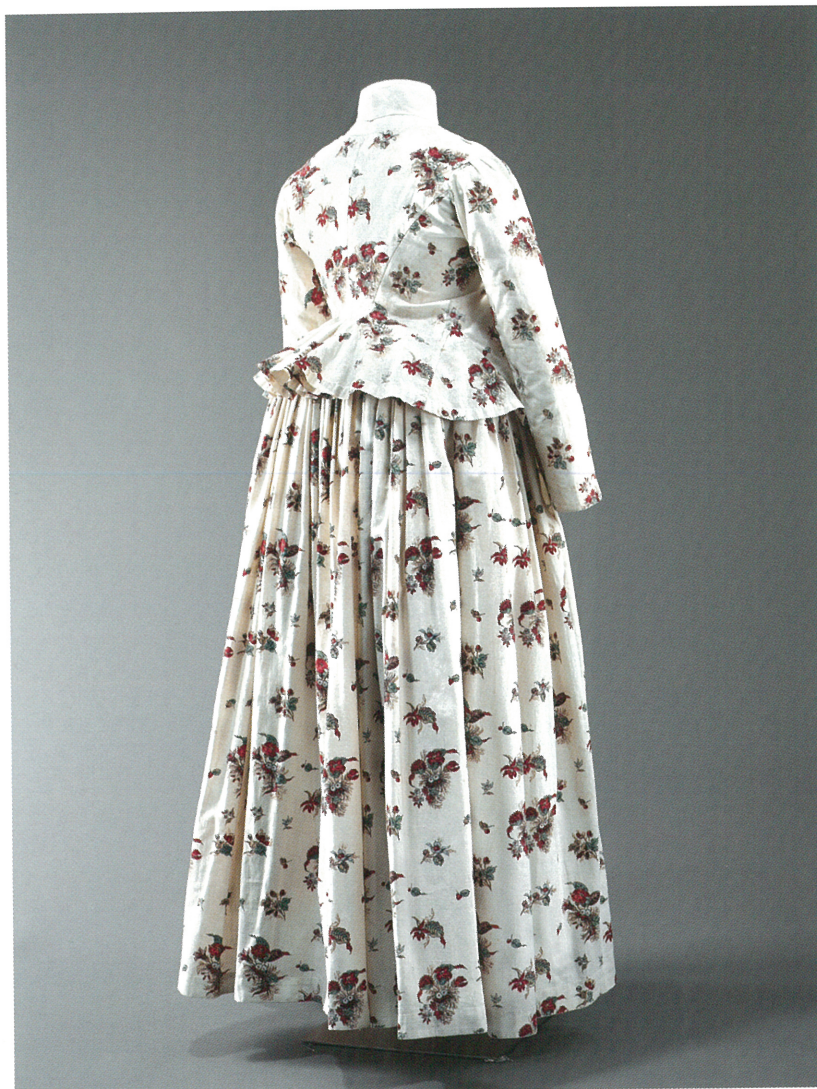
Fig. 37 : Robe en deux pièces, jupon et caraco, après 1790, coton d'indienne. Marseille, musée d'Histoire, inv. A/90/651

Entre 1752 et 1755, un glissement vocationnel s'est donc opéré : l'espace idéal, consacré à la formation et à la pratique artistique, a dû intégrer des contraintes plus pragmatiques et privilégier une vocation artisanale voire ouvrière. Certains documents d'archives laissent d'ailleurs apparaître des réminiscences de cet idéal purement artistique à travers une certaine condescendance pour les artisans formés au sein de l'Académie : « ceux d'un génie ordinaire et médiocre se bornent aux ateliers des manufactures de porcelaine et de faïence ou à ceux des divers arts mécaniques » rapporte ainsi un mémoire daté de 1778 5 . La démission rapide du peintre Fenouil en faveur de Michel-François Dandré-Bardon, puis le départ du sculpteur Jean-Michel Verdiguier, son installation en Espagne et sa renonciation à sa charge de directeur perpétuel de l'Académie 6 peuvent sonner comme une sorte de désaveu de la part des membres fondateurs ; ils traduisent surtout une mutation du projet initial et un élargissement des objectifs au profit du commerce et des centres de production.