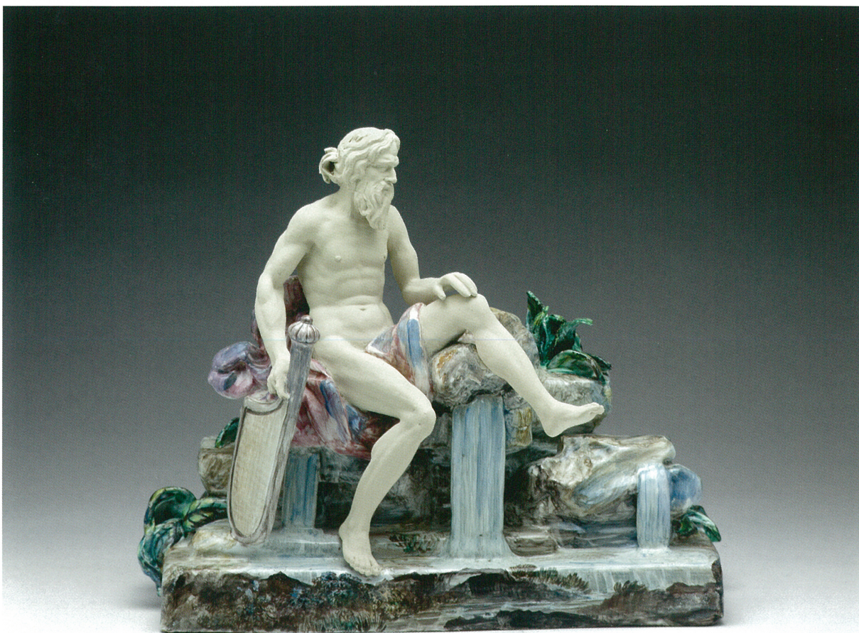
Fig. 41 : Honoré Savy (attribué à la fabrique d'), Le Rhône , seconde moitié du XVIII e siècle, faïence stannifère, décor de petit feu polychrome. Marseille, musée des Arts décoratifs, de la Faïence et de la Mode, château Borély, inv. GF 3959

et de nombreux ouvriers et entrepreneurs établis à Marseille se déplacent vers Aix-en-Provence, Orange, Montpellier ou même Nantes 41 . Pour autant, la production locale de toiles peintes et imprimées se révèle être de grande qualité et au fait des nouveautés décoratives véhiculées par l'Académie, efficace diffuseur de modèles dessinés ou gravés.