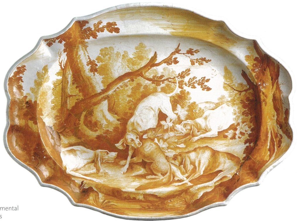
Fig. 38 : LA TOUR-D'AIGUES (fabrique de), Plat ovale (d'après une estampe de Jean-Baptiste Oudry gravée en 1725), seconde moitié du XVIII e siècle, faïence. La Tour-d'Aigues, musée départemental des Faïences, château de La Tour-d'Aigues

manufacture de porcelaine de Clignancourt, signe ici la qualité de la production de Savy et illustre la coloration économique du voyage princier. La visite à la manufacture de Gaspard Robert permet de signifier la qualité de la faïence locale mais aussi de sa porcelaine. Il est ainsi rapporté que le prince y admire particulièrement « un grand vase dont la forme, le dessin et la sculpture parurent lui causer une surprise agréable », ainsi qu'un service complet, avec de grands plats ovales, destiné à l'Angleterre 28 .