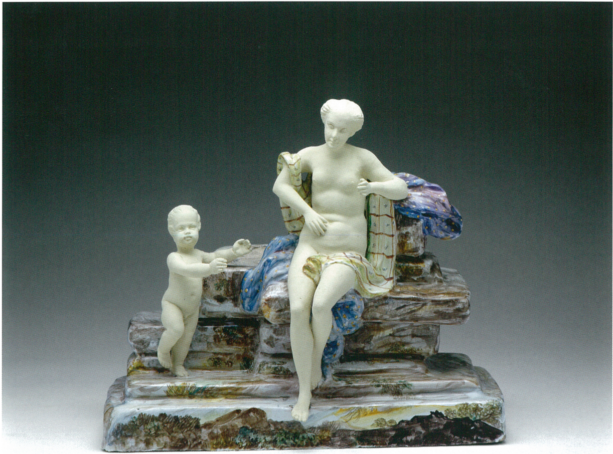
Fig. 42 : Honoré SAVY (attribué à la fabrique d'), La Durance , seconde moitié du XVIII e siècle, faïence stannifère, décor de petit feu polychrome. Marseille, musée des Arts décoratifs, de la Faïence et de la Mode, château Borély, inv. GF 3958

de passage entre Paris et l'Italie et au croisement de l'Orient et de l'Occident – se distingue par une production manufacturée marquée par un double mouvement de renouvellement permanent et de réemploi des motifs à succès. Ainsi, entre les années 1750, qui signent le passage des formes baroques aux motifs rocaille, et la fin des années 1780, qui voient éclore une esthétique épurée et antiquisante, les modulations sont nombreuses et témoignent d'un perpétuel goût pour le naturalisme, l'exotisme, tout comme de l'attraction exercée par le « grand art » sur les objets manufacturés.