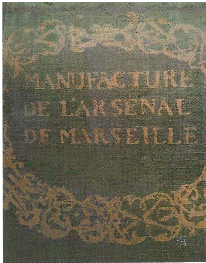
Fig. 40 : Marque de la manufacture de toiles peintes de l'Arsenal (revers de toile peinte), vers 1760-1770, provenant du château d'Hauteville, Saint-Légier (Suisse). Localisation actuelle inconnue