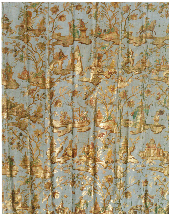
Fig. 39 : ANONYME, toile peinte à décor de chinoïseries sur fond gris-bleu, vers 1760-1770, provenant du château d'Hauteville, Saint-Légier (Suisse). Localisation actuelle inconnue

« Le degré de supériorité qu'elles [ces toiles] ont eu de tout temps et la perfection qu'elles ont acquise par la beauté des dessins, et le goût qu'elles doivent aux artistes que l'Académie de peinture de Marseille leur a fournis, en la personne de ses élèves, leur attirent une consommation immense, de la part de l'Italie surtout 37 . »