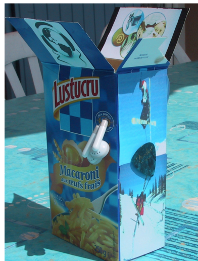
Figure 2 Exemple de deux « boîtes qui me représentent » (extrait de l'étude de Mailles-Viard Metz et al., 2011)