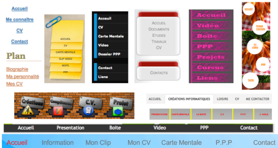
Figure 4 Différents menus proposés par les étudiants pour leur e-portfolio