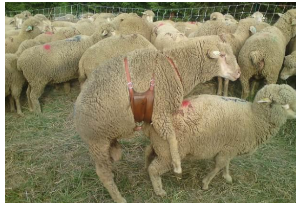
Figure 3 : Bélier équipé du détecteur de chevauchements Alpha®.