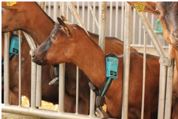
Figure 2 : Chèvres équipées de colliers-activimètres Heatime® (crédit photo INRA/Evolution).