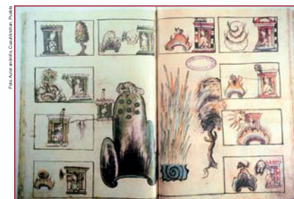
Figura 7: Cholula y los gobernantes olmecas xicalancas. Historia Tolteca Chichimeca.

El trabajo de campo consistió en consultas (tomas fotográficas y recopilaciones de inventario) llevadas entre 2009 y 2010 en varias instituciones universitarias (UNAM, UDLA y MNAX) y del INAH de Tlaxcala, Puebla, Morelos, México. Para organizar de forma razonada y orientada el material, se crearon cuatro bases de datos.