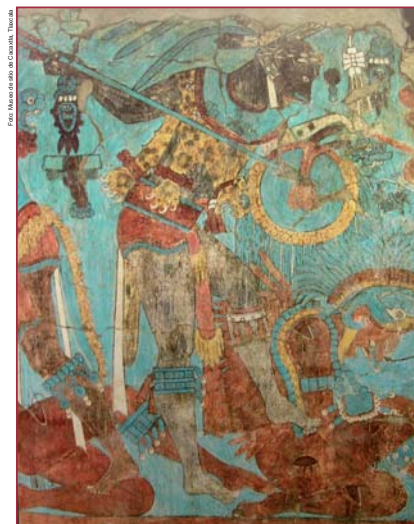
Figura 2: Parte del mural de la Batalla, Cacaxtla, Tlaxcala.

¿Cuál es la conexión entre un material y una modalidad de la interacción: comercio / migración / intercambio entre élites? ¿Existe homogeneidad en este fenómeno? (figura 5)