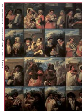
Figura 6: Cuadro de castas anónimo ilustrando el mestizaje en Nueva España, principios del siglo XVII.

El análisis iconográfico se articula alrededor del estudio de la forma y del fondo. Por un lado, representaciones de los actores y del espacio, por el otro, recurrencias, contextos y significado de los motivos y de los glifos.