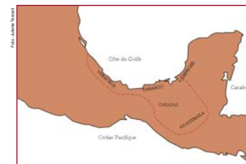
Figura 5: Área de interacciones con los sitios de estudio.