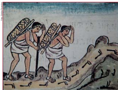
Figura 1: Pochtecas o comerciantes.

En arqueología mesoamericana, el estudio de interacciones culturales es cada vez más privilegiado, dada la importancia de este fenómeno en la historia de civilizaciones antiguas (figura 1).