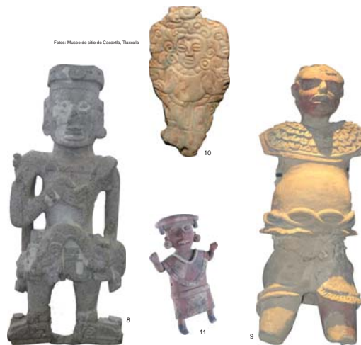
Figura 8: Xochicalco, Morelos; Figura 9: Cacaxtla, Tlaxcala; Figura 10: Placa de jade, Cacaxtla, Tlaxcala; Figura 11: Xochitecatl, Tlaxcala.

Los primeros resultados de la investigación indican que las interacciones culturales con el Oriente mesoamericano afectan principalmente contextos relacionados con las esferas del poder político y religioso.