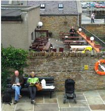
a – Two people sitting in front of an older building on a bench.

FIGURE 3 – Exemples d'images pour lesquelles le classifieur a utilisé uniquement les caractéristiques visuelles pour corriger le rattachement de la préposition (en rouge).