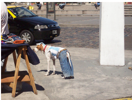
a – A dog is wearing jeans and a blue and yellow shirt with a black vehicle in the background.

FIGURE 4 – Exemples d'images pour lesquelles le classifieur a mal corrigé le rattachement de la préposition (en rouge) avec des caractéristiques visuelles uniquement.