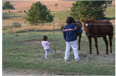
b – Two children are in a grassy area near two horses.

FIGURE 3 – Exemples d'images pour lesquelles le classifieur a utilisé uniquement les caractéristiques visuelles pour corriger le rattachement de la préposition (en rouge).