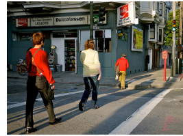
b – Two younger women and an older man in a red sweatshirt are walking across a crosswalk in San Francisco.

FIGURE 4 – Exemples d'images pour lesquelles le classifieur a mal corrigé le rattachement de la préposition (en rouge) avec des caractéristiques visuelles uniquement.