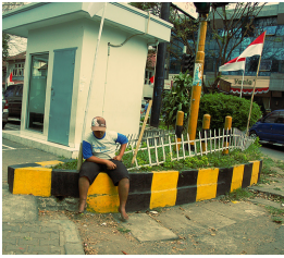
a – A boy sitting on a concrete wall with a hat on.

visuelles uniquement permet d'effectuer le bon rattachement, alors que l'utilisation de caractéristiques linguistiques seules produit une erreur. Dans la Figures 5.a, la préposition with est incorrectement rattaché au mot jeans à la place du mot wearing . Dans la Figures 5.b, la préposition in est rattaché au mot bike au lieu du mot boy .