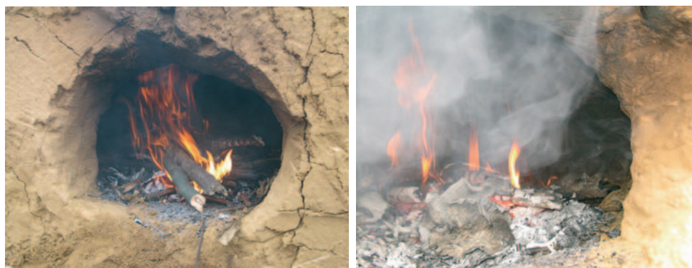
Fig. 4 - Foyer au cœur du four.