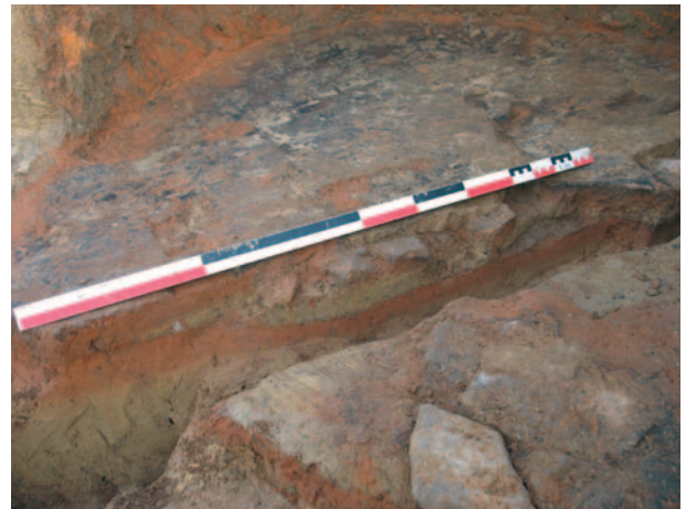
Fig. 2 - Vues de soles en coupe photo et relevé.

Le critère le plus pertinent et le plus visible d'une cuisson est la rubéfaction. Elle est observable à la fois à la fouille et lors d'expérimentations, en perforant les croûtes des soles et des parois (fig. 2). Les coupes ainsi réalisées permettent de noter les épaisseurs, la coloration et la dureté des couches rubéfiées.