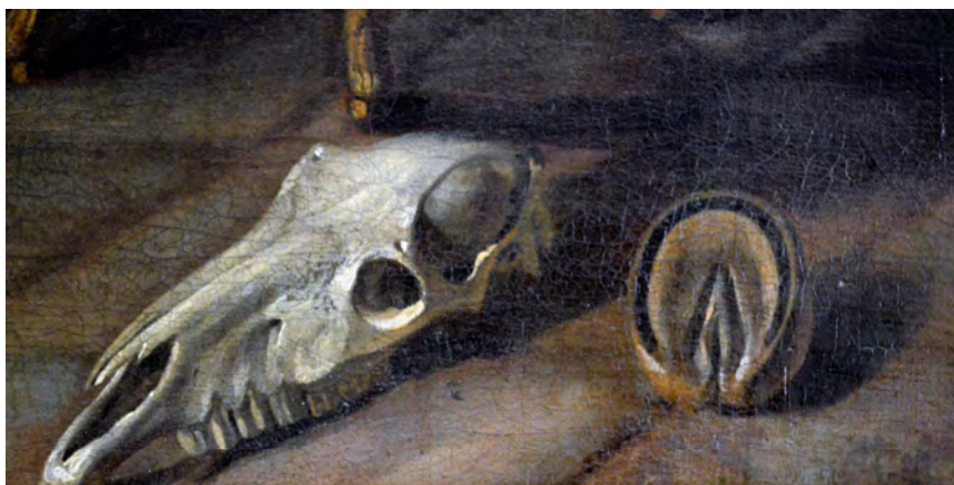
Fig. 7 : Fer Lafosse enclavé.

Détail du tableau anonyme du XVIII e siècle :