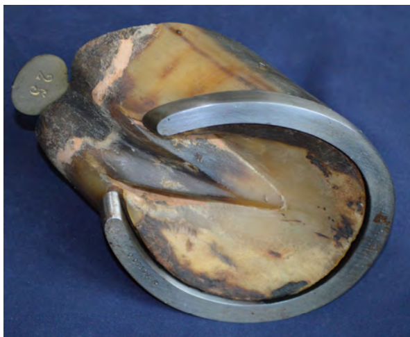
Fig. 8 : Fer Charlier. Collection de pieds ferrés de l'adjudant Grasser, 1913.