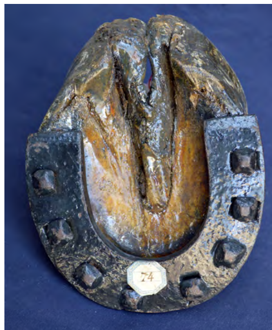
Fig. 6 : Fer Lafosse à croissant.

La première solution prônée par Lafosse n’était pas nouvelle : c’était le fer à lunette ou fer en croissant, déjà décrit par Fiaschi au XVI e siècle, censé « empêcher les chevaux de glisser sur le pavé sec et plombé 23 ». Ce fer avait des éponges raccourcies, qui allaient en s’amincissant pour se terminer au milieu des quartiers 24 ; la pince, partie qui devait résister à la forte usure de la propulsion, était épaisse. L’ensemble fournissait à la fourchette et aux talons un bon appui au sol, en assurant le jeu supposé du pied ( Fig. °6 ).