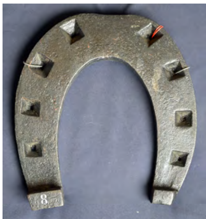
Fig. 5 : fer à l'allemande.

La même ferrure, alourdie, devait par la suite être qualifiée de ferrure à l'allemande . Sous les sabots des chevaux de labour, son épaisseur lui permettait de résister à l'usure en pince 8 et en mamelle 9 externe, ce qui garantissait une longue utilisation tout en favorisant l'adhérence du pied. Les crampons pénétraient profondément dans la terre ( Fig.°5 ). Ils affermissaient l'appui, empêchaient les glissades funestes au destrier et au cavalier.