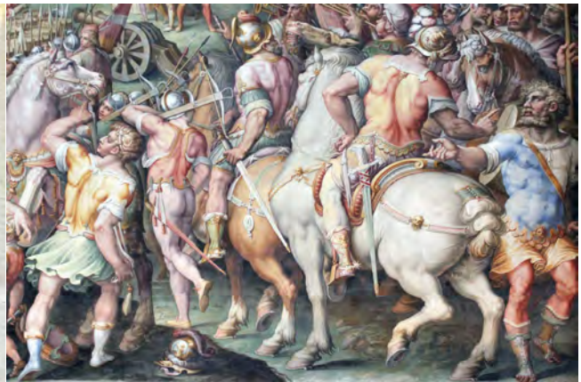
Fig. 3 : Détail d'une fresque de Giorgio Vasari dans la salle des Cinq-Cents du Palazzo Vecchio de Florence.