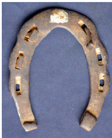
Fig. 1 : Fer ondulé

La question de la datation des premiers fers cloués a été et reste un sujet de controverse chez les scientifiques et nous nous garderons bien d'aborder ce problème. Tout au plus peut-on dire que le Moyen Âge usa de fers peu variés. De nombreux musées en exposent dont la plupart sont dits ondulés en raison de la déformation de leur rive 3 externe, bombée en regard de chaque étampure 4 au moment de la fabrication. Lorsque le maréchal perçait dans la matière chaude et malléable les orifices destinés aux clous, la rive externe était refoulée vers l'extérieur. Ces fers sont souvent peu couverts 5 et présentent des éponges tantôt pliées 6 à angle droit, tantôt retournées sur elles-mêmes pour former des crampons (Fig. 1).