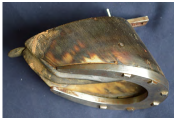
Fig. 9 : Fer Poret. Collection de pieds ferrés de l'adjudant Grasser, 1913.