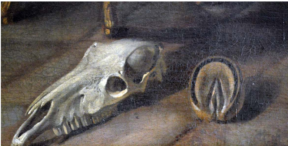
Fer Lafosse enclavé. Détail d'Une leçon d'anatomie chez Lafosse.