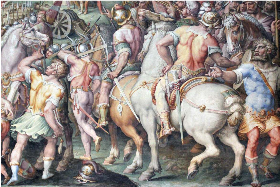
Détail d'une fresque de Giorgio Vasari dans la salle des Cinq Cents du Palazzo Vecchio de Florence.