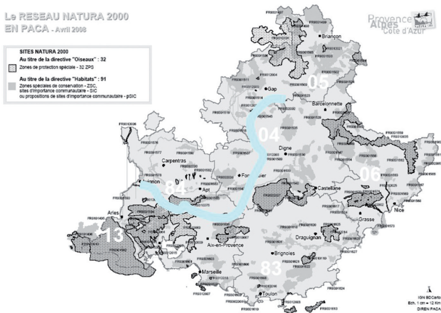
Illustration 1 : le site Natura de la basse Durance en région PACA.

Pour les grands sites, l'élaboration d'un Docob représente un travail considérable nécessitant plusieurs années de diagnostic, de réunion de concertation et d'écriture des mesures de gestion. L'exemple ici présenté, le site de la basse Durance, concerne un linéaire de 200 kilomètres de rivière, regroupe 81 communes, 19 intercommunalités, 3 parcs naturels régionaux, 5 pays, 5 départements et abrite 30 Znieff, 9 Scot, 7 Appb et un contrat de rivière.