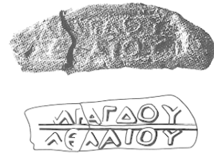
Fig. 36 — Collyre 19.