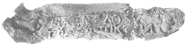
Fig. 30 — Collyre 2.

ces derniers sont mentionnés par Marcellus à propos d'un de ses deux collyres stratioticum 59 . Mais il va de soi que l'usage de tels collyres débordait le milieu militaire.