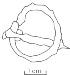
Fig. 37 — Boucle en fer.

Analyse pollinique : sur douze pollens, neuf d' Euphrasia officinalis L., un du genre Artemisia et un de l'espèce Xanthium strumarium L. (lampourde anticrofuléuse).