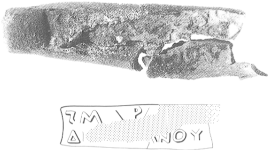
Fig. 33 — Collyre 7.