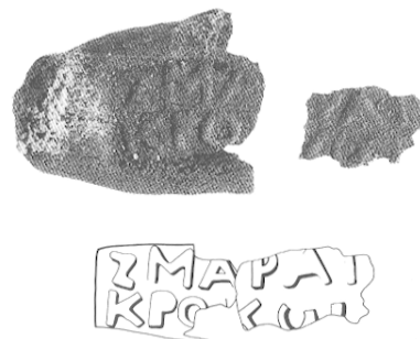
Fig. 34 — Collyre 9.

État (fig. 34) : intact lors de la découverte ; très fragmenté lors de l'accident. Forme originelle : petit pain oblong. Dimensions : longueur restituée d'après cliché pris in situ : environ 35 mm ; largeur maximale d'une extrémité conservée : 9,9 mm ; épaisseur : 3 mm. Couleur : en surface, rouge sombre voisin des n°s 102 de Séguy et S15 de Cailleux.