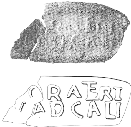
Fig. 35 — Collyre 18.