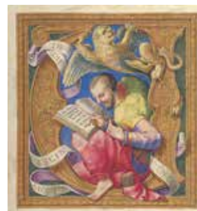
Fig. 12 – Apollonio de' Bonfratelli, Ascension du Christ , Vatican, BAV, Vat. lat. 3805, fol. 66 ro (détail).

En dehors d'être un acte et un élément réflexifs, la citation constitue l'unité de base du missel, puisque ce livre liturgique est composé d'extraits des Écritures. Le discours théologique propose, comme le dit Antoine Compagnon, une systématique de la citation 37 . Dans la paire de l' Ascension du Christ (fig. 11), l'évangéliste Marc est niché dans l'initiale «V» ouvrant sur le texte issu des Actes des Apôtres (fig. 12). Il est représenté en train d'écrire la partie de son évangile relatif à l'épisode de l'Ascension, représenté sur le feuillet opposé.