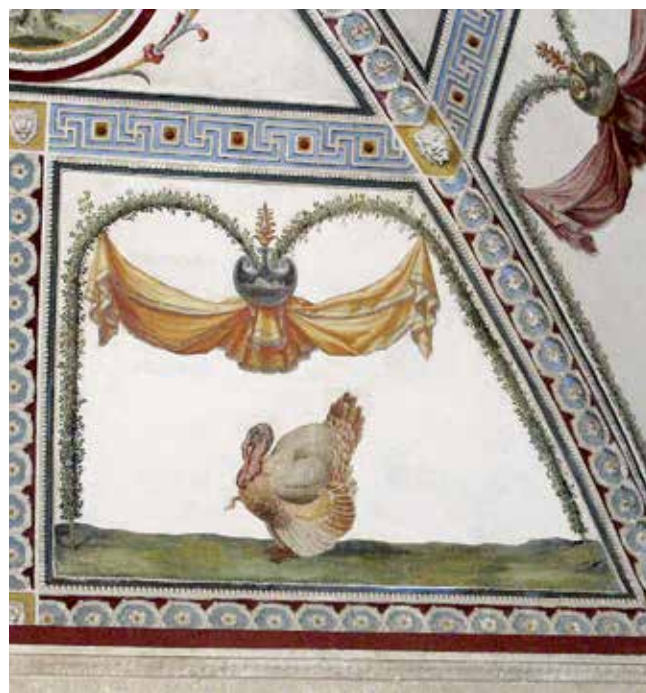
Fig. 17 – Giovanni da Udine, Salon de Clément VII , Rome, villa Madama.