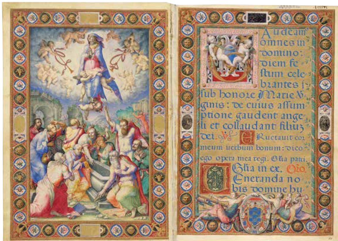
Fig. 7 – Apollonio de’ Bonfratelli, Ascension de la Vierge , Vatican, BAV, Vat. lat. 5591, fol. 87v-88r.