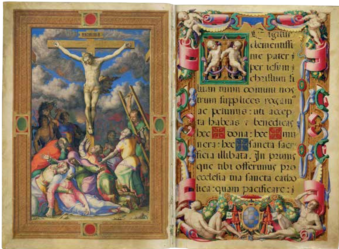
Fig. 6 – Apollonio de’ Bonfratelli, Crucifixion , Vatican, BAV, Vat. lat. 3807, fol. 60v-61r.