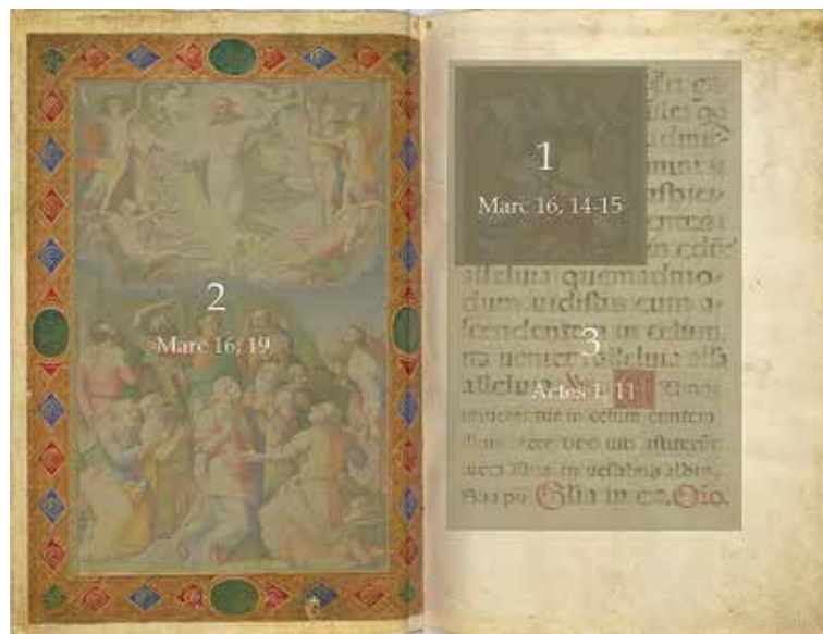
Fig. 13 – Apollonio de' Bonfratelli, Ascension du Christ , Vatican, BAV, Vat. lat. 3805, fol. 65 vo -66 ro.

La phrase « in illo/tempor/recvbe/tibvsv/deci di/scipv/ap 38 » (visible à l'œil nu) raconte le moment du récit ayant lieu immédiatement avant l'Ascension, tandis que le texte principal raconte le moment intervenant immédiatement après cette dernière 39 . Ces trois moments se trouvent ainsi réunis à travers le texte et l'image (fig. 13). Mais c'est peut-être l'acte même de parcourir mentalement les textes et d'effectuer le travail de synthèse, qui est mis en scène par la représentation 40 . Les différents moments de lecture croisent les différents moments de production du texte et de sa réutilisation. Le texte-source (représenté entre les mains de Marc) et son fragment-citation (écrit par l'évangéliste) ornent le texte-produit (texte du missel) dont ils constituent les ingrédients. Ce n'est peut-être pas un