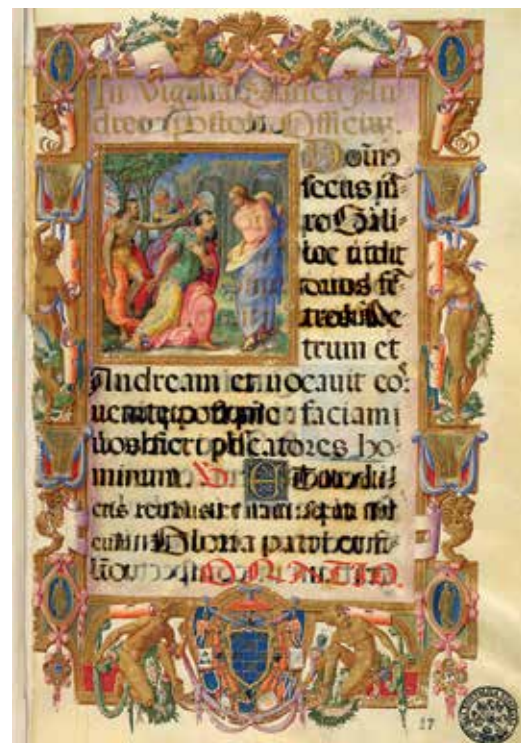
Fig. 9 – Apollonio de' Bonfratelli, Appel de saint André , Vatican, BAV, Vat. lat. 5590, fol. 17 r°.

Ce jeu continue dans les enluminures suivantes, où l'on assiste à une remise en question progressive du support. Les dispositifs encadrants sont emboîtés, superposés, enchevêtrés. Démultipliant les niveaux de la représentation par rapport au degré zéro du parchemin, le décor met en avant son ambiguïté. Sur le feuillet de l' Appel de saint André par exemple (fig. 9), bien que le texte s'inscrive sur le parchemin vierge, les enroulements qui échappent et passent derrière et devant le cadre – parfois de manière paradoxale – brouillent la distinction entre transparence et opacité 33 . Les caryatides s'y appuient, les putti rentrent dedans, tout comme les festons et les rubans. Situés au seuil de l'ambiguïté de la représentation, ces figures instaurent une zone où l'imagination du lecteur explore les limites du possible 34 .