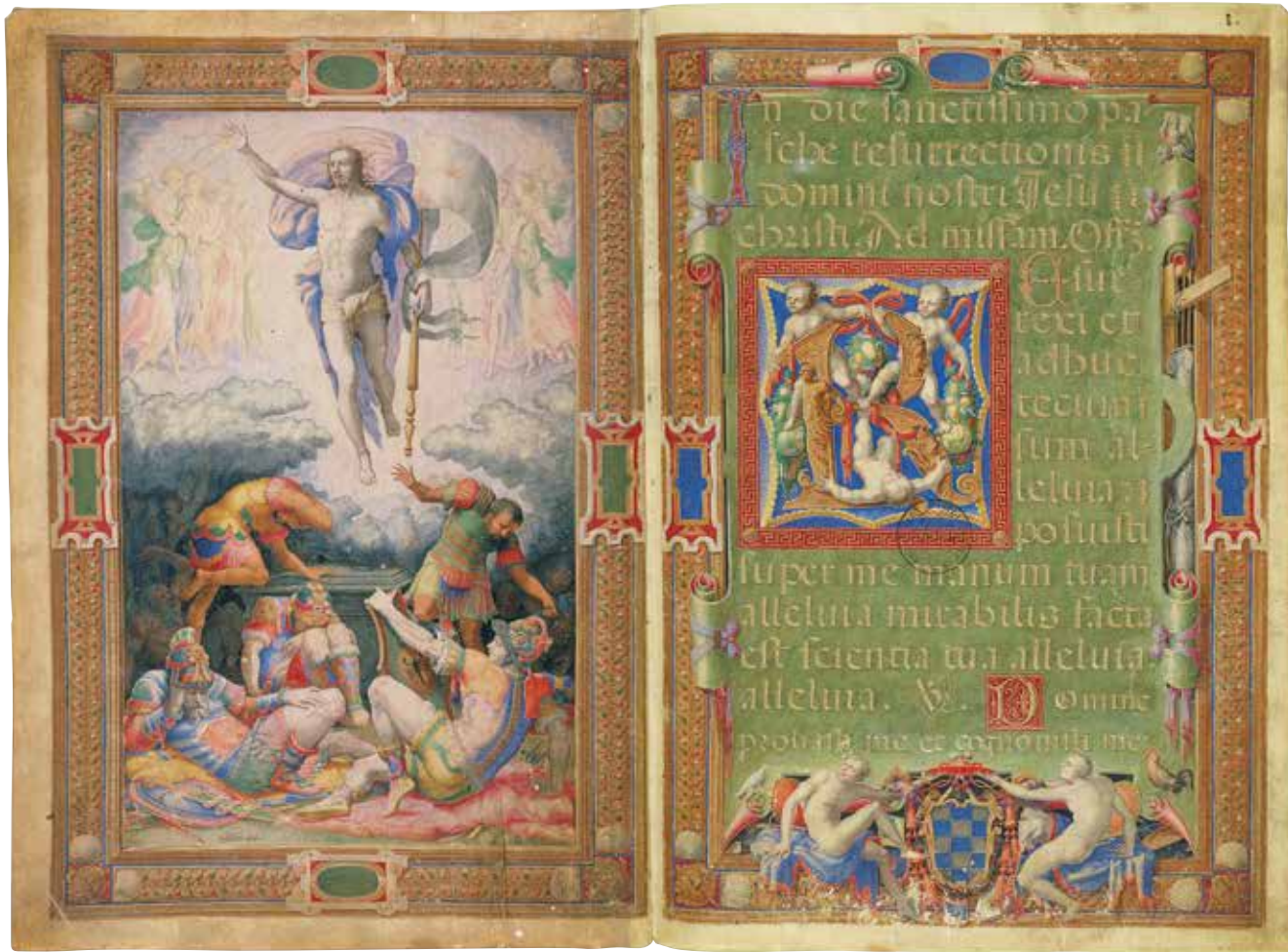
Fig. 1 – Apollonio de' Bonfratelli, Résurrection , Vatican, BAV, Vat. lat. 3805, fol. 1 vo -1 ro .

l'orientation de son imagination. Quant à l'ornement textuel, il sert d'instrument de concentration et d'intensification de l'attention du lecteur. Sa principale fonction serait – sous la forme de l'ironie, du paradoxe, de la surprise, de l'obstacle, etc. – d'attacher la mémoire au jeu des associations produites par l'esprit au travail. Dans sa traduction visuelle, l'ornement des manuscrits médiévaux conditionnait l'imagination du lecteur et lui indiquait comment lire, mémoriser, goûter et même ruminer les textes, tout en lui offrant des moments de repos et de plaisir, suivant le concept rhétorique du ductus 10 . Comme nous allons le voir, ces enjeux de la lecture méditative offrent aux enlumineurs de l'époque de la maniera un terrain propice à l'expérimentation.