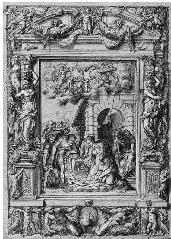
Fig. 15 – Anonyme, Adoration des bergers , Londres, Victoria and Albert Museum, Inv. n° 8078.