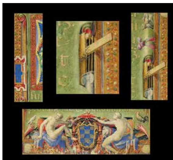
Fig. 3 – Apollonio de' Bonfratelli, Résurrection , Vatican, BAV, Vat. lat. 3805, fol. 1 r o (détails).