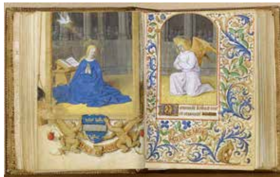
Fig. 2 – Livre d'heures, Annunciation , Paris, BnF, département des Manuscrits, NAL 3203, fol. 29 v o-30 r o.