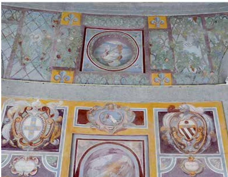
Fig. 18 – Cortile (a), Piano nobile (b), Caprarola, villa Médicis.