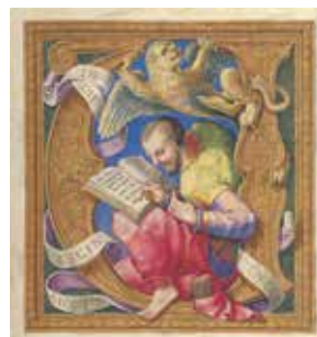
Fig. 12 – Apollonio de' Bonfratelli, Ascension du Christ , Vatican, BAV, Vat. lat. 3805, fol. 66 ro (détail).

En dehors d'être un acte et un élément réflexifs, la citation constitue l'unité de base du missel, puisque ce livre liturgique est composé d'extraits des Écritures. Le discours théologique propose, comme le dit Antoine Compagnon, une systématique de la citation 37 . Dans la paire de l' Ascension du Christ (fig. 11), l'évangéliste Marc est niché dans l'initiale «V» ouvrant sur le texte issu des Actes des Apôtres (fig. 12). Il est représenté en train d'écrire la partie de son évangile relatif à l'épisode de l'Ascension, représenté sur le feuillet opposé.