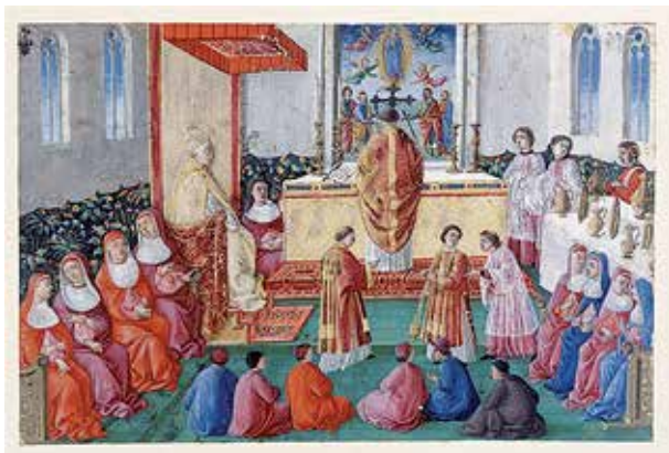
Fig. 19 – Giuliano Amadei, Fragment d'un missel d'Innocent VIII, Chantilly, musée Condé, Divers IV-346.

intégré dans leurs ménageries à Rome 58 . La dinde fait partie d'un ensemble plus vaste de représentations d'oiseaux sur notre feuillet. Du point de vue de l'art de la mémoire et de la décoration livresque, ce motif est commun mais aussi très puissant. Fonctionnant comme une allusion à l'arbre et au livre de la vie 59 , les oiseaux apportent une dimension d'animation virtuelle et la promesse d'un chant harmonieux en accord avec le chant angélique auquel il est fait allusion dans le registre supérieur de la scène avec l'inscription « Gloria in excelsis deo ». Quelle serait la place de la dinde au sein de ce système ?