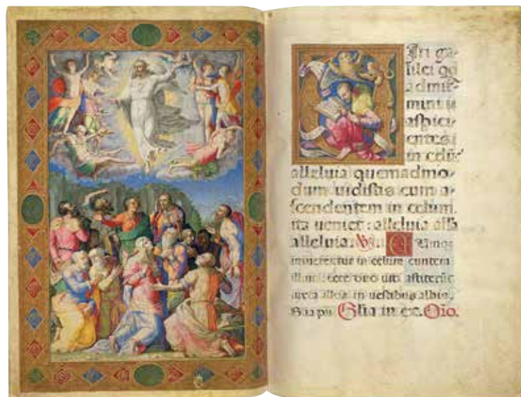
Fig. 11 – Apollonio de' Bonfratelli, Ascension du Christ , Vatican, BAV, Vat. lat. 3805, fol. 65 vo -66 ro .

Dans le feuillet consacré à la Toussaint (fig. 10), contenant le trône de Dieu inspiré du texte de la Révélation 35 , la vibration sémantique est portée à l'excès, toujours à cause de ou grâce à l'ornement et au traitement ornemental de l'initiale «G». La phrase «Gaudeamus omnes in domino diem festum» déborde du cartouche sur le reste du feuillet laissé vierge. L'initiale est rendue de manière tridimensionnelle, mais son entrelacement avec la lettre suivante, complètement bidimensionnelle, introduit une crise, un «détail-comble 36 » dans la représentation, que l'on pourrait interpréter comme une illustration de l'oscillation entre signe et signification qui a lieu quand on lit le texte, puisque ce dernier fait corps avec la structure décorative et se transforme durant et grâce à la lecture. Cet arrangement renforce davantage la dimension réflexive de la méditation et provoque encore une fois un effet de distanciation facilitant la compréhension du texte.