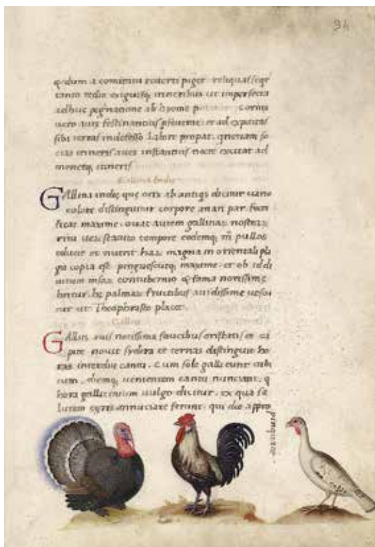
Fig. 16 – Pier Candido Decembrio, De omnium animantium naturis , Vatican, BAV, Urb. lat. 276, fol. 94 r .