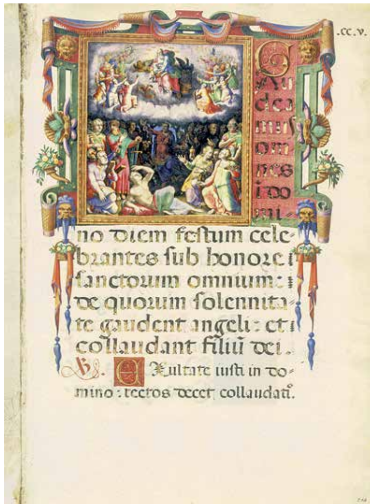
Fig. 10 – Apollonio de' Bonfratelli, Toussaint , Vatican, BAV, Vat. lat. 5591, fol. 204 ro .