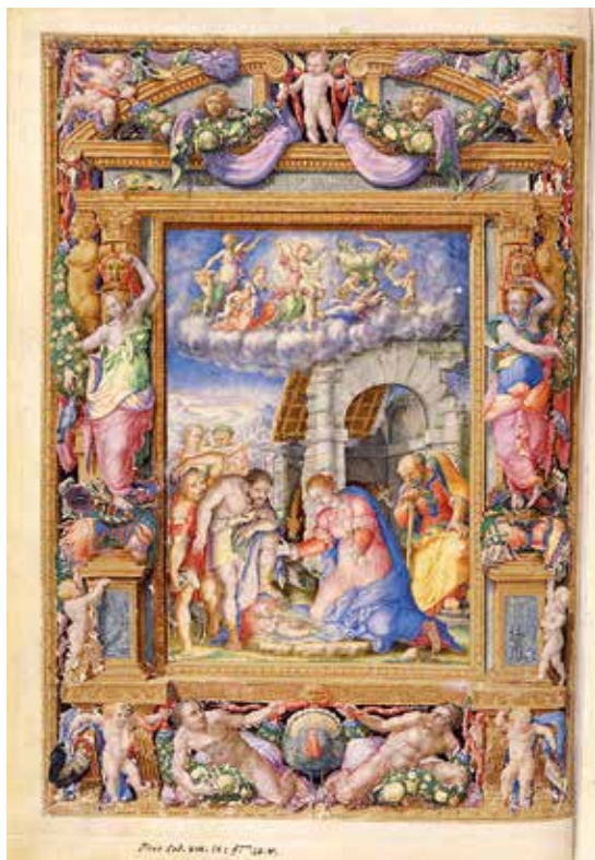
Fig. 14 – Vincent Raymond, Adoration des bergers , Vatican, BAV, Barb. lat. 609, fol. 48 v .