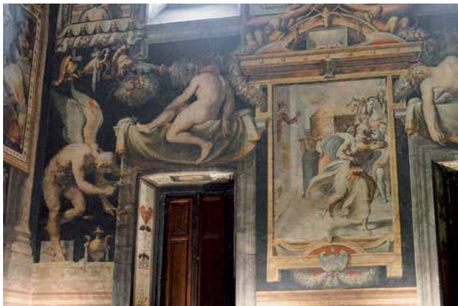
Fig. 8 – Francesco Salviati, Kairos , Rome, palais Ricci-Sacchetti.

Cet enrichissement du vocabulaire décoratif concernant le support du logos incarné fournit un nouveau terrain pour les jeux de trompe l'œil. La solution du morceau de parchemin découpé et accroché sur le fond de la page de manière tout à fait illusionniste est apparue dans différents codex du Nord de l'Italie vers la fin du XV e siècle. La déchirure ou le percement du parchemin réel fit également son apparition dans les livres imprimés et peints à la main 30 . La solution proposée ici croise d'autres traditions de l'art dévotionnel. Au lieu d'une déchirure, un écart discret et élégant, produit par le léger décentrement du cartouche, permet l'irruption des Arma Christi , de manière perpendiculaire par rapport au plan de l'image. Dispositif mnémotechnique efficace, prenant ici la forme d'un tropaeum crucis que l'artiste place dans la marge du texte où l'on trouve habituellement des spoglia renvoyant à la gloire de l'empire romain 31 , les Arma Christi condensent les épisodes de la Passion. Dans le cas de ce feuillet, ils font confluer, grâce à leur représentation en trompe l'œil, la violence du récit de la Passion et celle que le trompe l'œil impose au regard du spectateur 32 . Le mécanisme mnémotechnique rencontre l'invention visuelle.