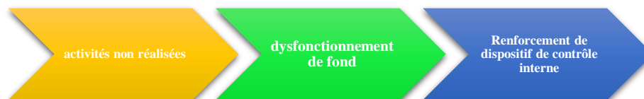
Figure 3: Contrôle interne comme outil d'amélioration de processus de contrôle de gestion (réalisé par nous même)

Il ressort de ce qui précède que le processus de contrôle au sein de l'Office est un contrôle interne légal, dont la mission est la conformité et la régularité avec la réglementation budgétaire et administrative. Les lois et les règlements constituent les outils fondamentaux du contrôle interne, à l'instar des autres établissements publics. Ce contrôle reste statique et ne s'adapte pas aux fluctuations de l'environnement, notamment la nécessité de contribuer à la maximisation de la valeur et la minimisation des coûts. Le contrôle de gestion, quant à lui, est orienté vers la présentation des résultats, au lieu de s'intéresser à la recherche des causes des écarts et la présentation des actions à entreprendre. En effet, la dimension pilotage est quasi absente. Il s'agit de contrôle de gestion à l'information à consolider et à remonter aux échelons supérieurs, en délaissant l'objectif de pilotage des activités de l'Office. Les deux processus sont distincts et s'interagissent.