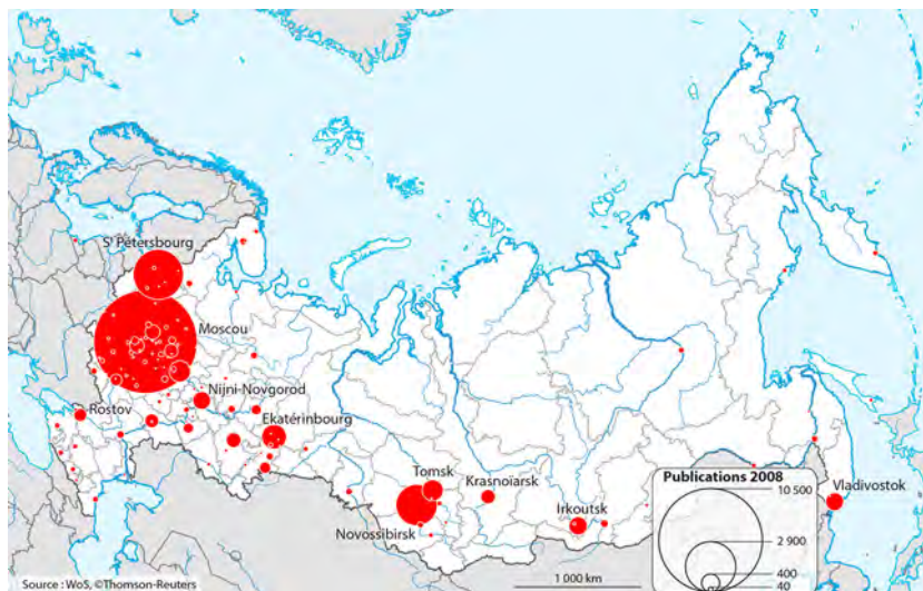
FIGURE 1 – La production d'articles scientifiques en Russie (2006-2008)

Le tableau ci-dessous (tableau 2) précise la vision d'ensemble de la carte. On remarque que la liste des principaux centres scientifiques actuels est loin d'épouser la hiérarchie urbaine : certaines grandes métropoles d'un million d'habitants, Volgograd par exemple, Perm ou Samara n'apparaissent pas ici. On voit par contre le rang très honorable de petites villes spécialisées : ainsi Tchernogolovka, commune de 20 000 habitants qui, dans l'orbite de Moscou (elle n'est distante que de 60 km du Kremlin), a une contribution supérieure en termes de publication à Volgograd, pourtant ville de plus d'un million d'habitants et dotée de surcroît d'un nombre important d'établissements d'enseignement supérieur !