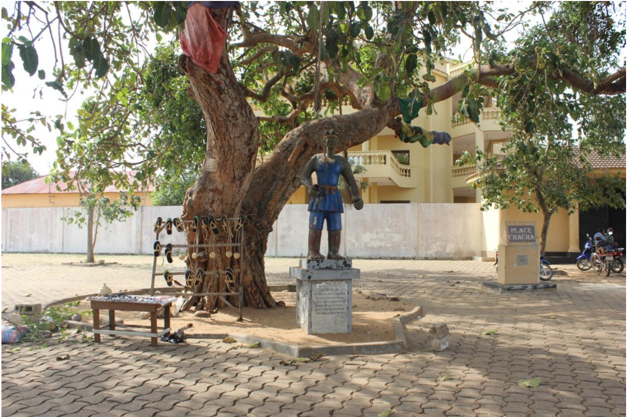
Fig.2 :« Place des enchères » de Ouidah. En premier plan, on voit la statue représentant une amazone, réalisée par le plasticien Cyprien Tokoudagba. Les objets qui étaient placés dans ses mains ont disparu. L'espace est investi par des supports marchands. Sur l'arbre, quelques drapeaux, installés en 2012 par E. Aplogan, sont encore présents. En arrière plan, la stèle commémorative en l'honneur de Chacha est visible, surplombée par la demeure des héritiers du commerçant brésilien. Photo : R. Goussanou, février 2017.