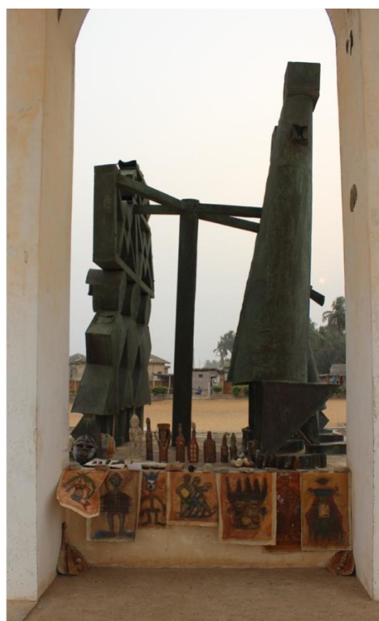
Fig 3 : Transformation des colonnes de la « Porte du Non-Retour » (réalisée par F. Bandeira et Y. Kpédè) en un espace mercantile. Photo : R. Goussanou, février 2017.