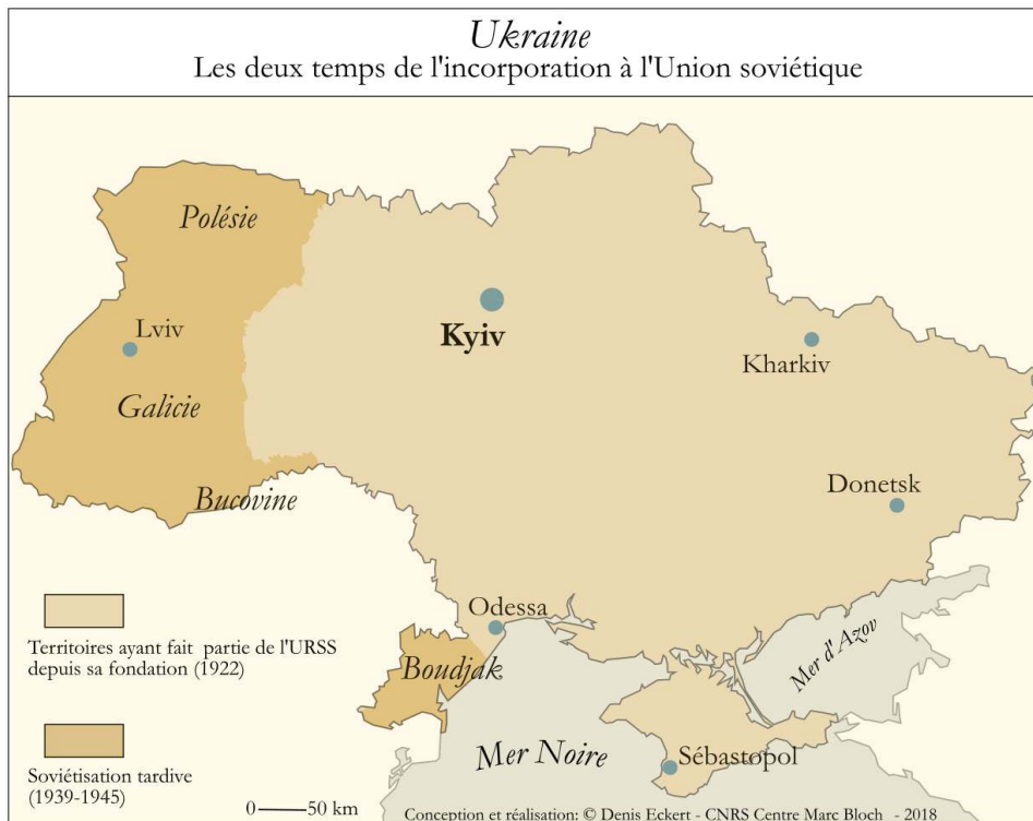
Carte 2 : Ukraine : les deux temps de l'incorporation à l'Union Soviétique

Conception et réalisation : © Denis Eckert – CNRS Centre Marc Bloch - 2018