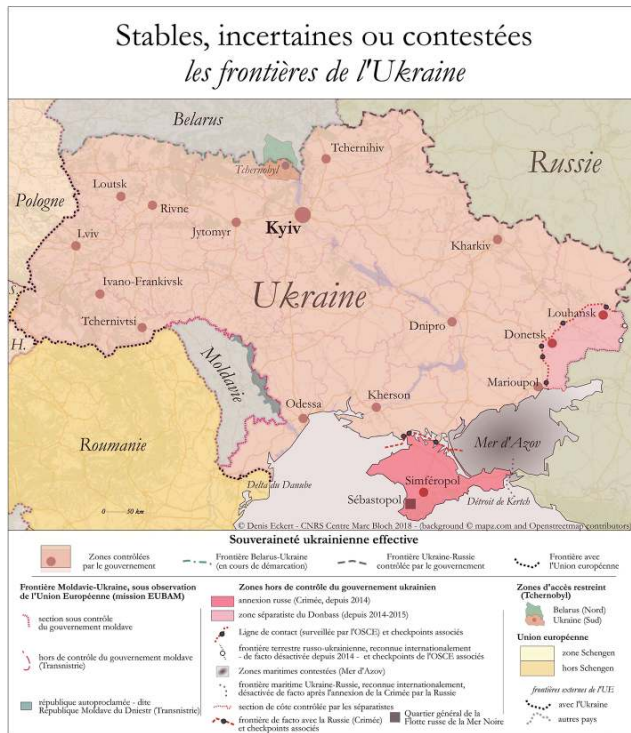
Carte 1 - Stables, incertaines ou contestées, les frontières de l'Ukraine

Conception et réalisation : Denis Eckert – 2018