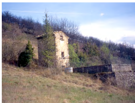
Divers types de cabanons du Var et du Vaucluse