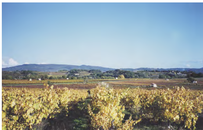
Semis de cabanons dans un espace rural du Pays d'Aigues