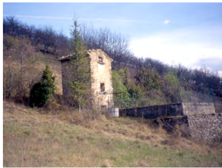
Divers types de cabanons du Var et du Vaucluse