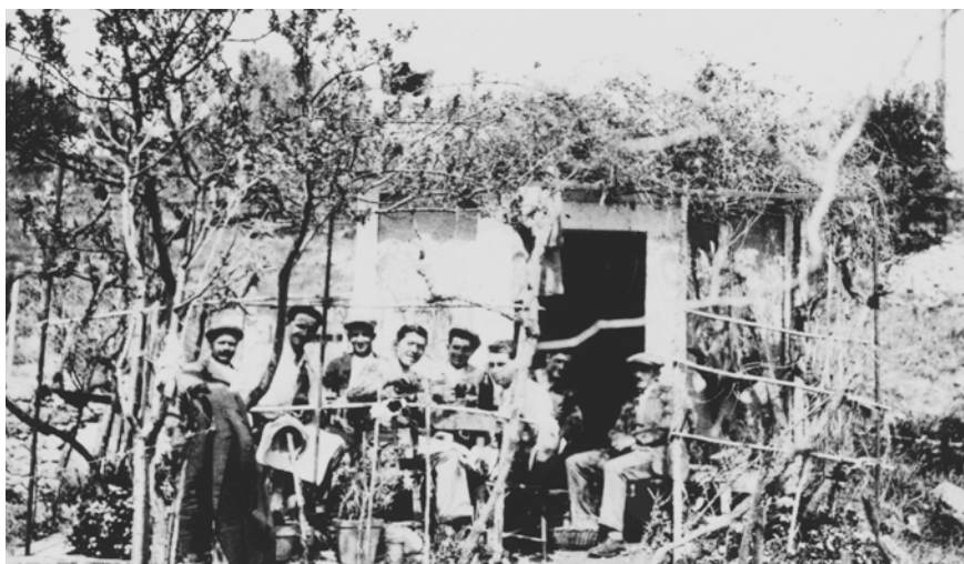
Un dimanche au cabanon

Situés dans des espaces éloignés de la vie quotidienne, les cabanons s'offrent comme des lieux propices à une certaine forme de sociabilité masculine. Les noms qu'on lui donne -ribote, bombance, bringue, virée au cabanon- et qui changent selon les lieux et les époques, indiquent d'emblée le caractère de joyeuse convivialité qui la caractérise. Mais de quoi s'agit-il ? D'assemblées de huit à douze hommes qui se sont choisis -et que peut lier, par ailleurs, une passion commune- se réunissant de