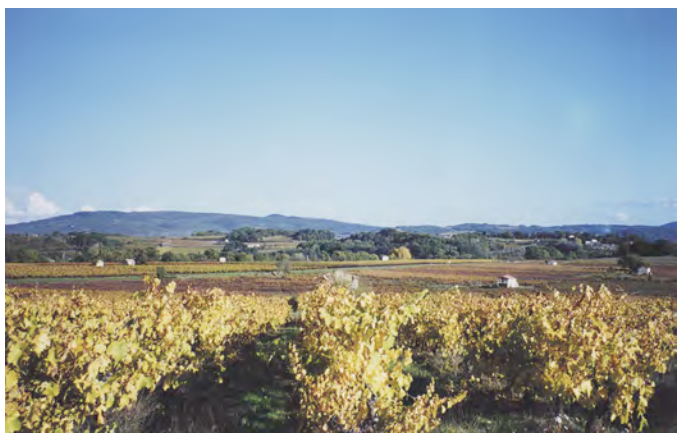
Semis de cabanons dans un espace rural du Pays d'Aigues