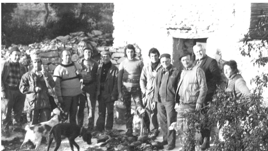
Assemblée de chasseurs devant un cabanon du Var (années 70)

Provence connote l'amitié et non forcément les relations professionnelles). Si elles se composent le plus souvent de villageois, familiers du territoire, qui en forment le noyau stable, elles ne sont pas systématiquement fermées au visiteur occasionnel, ami ou parent d'un des habitués qui, au contraire, en forme une des figures ordinaires. Le caractère exclusivement masculin de ces réunions est tout autant la condition que l'expression d'un certain basculement des comportements et des valeurs en vigueur dans leur univers habituel 12 . Ainsi ces hommes qui, dans leur foyer, se tiennent à l'écart des fourneaux et des tâches ménagères, font ici la cuisine -une cuisine à base de viande grillée et de nourritures "fortes" qui contraste avec la nourriture ordinaire- et se partagent les corvées d'entretien. La sobriété, naturelle en famille, fait place à des menus pléthoriques et abondamment arrosés. La mesure du langage et des attitudes, en vigueur à la maison, s'efface devant une liberté de parole et d'expression rarement atteinte ailleurs, par exemple au café ou sur la place, autres lieux de rencontres masculines dans l'espace plus contraint du village. Les plaisanteries, les histoires, les chansons scabreuses, forment, avec les histoires de chasse, le répertoire