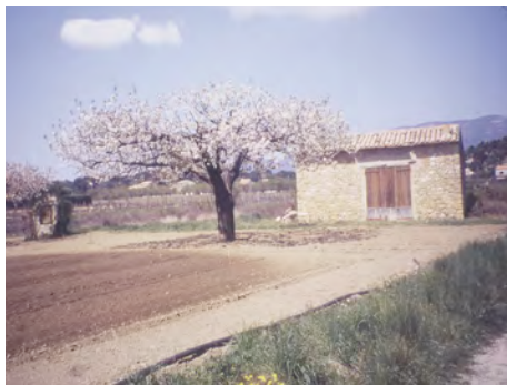
Divers types de cabanons du Var et du Vaucluse