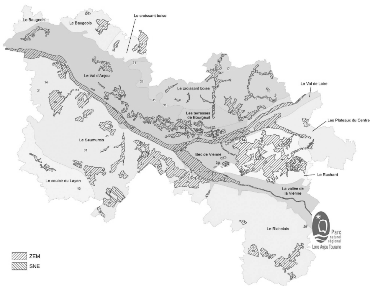
Figure 3 : Carte de localisation des sites étudiés durant la démarche-test d'ACC du Parc Naturel Régional Loire-Anjou-Touraine (ZEM : zones écologiques majeures, SNE : sites naturels exceptionnels)

Location map of the protected areas of the Parc Naturel Régional Loire-Anjou-Touraine, included in the adaptation approach focus (ZEM: main ecological zones, SNE: outstanding natural sites)