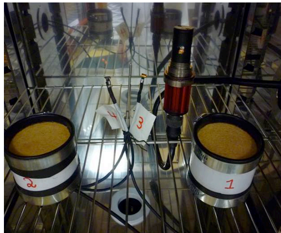
Fig. 1 : Echantillons dans le dispositif expérimental