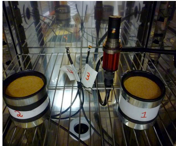
Fig. 1 : Echantillons dans le dispositif expérimental