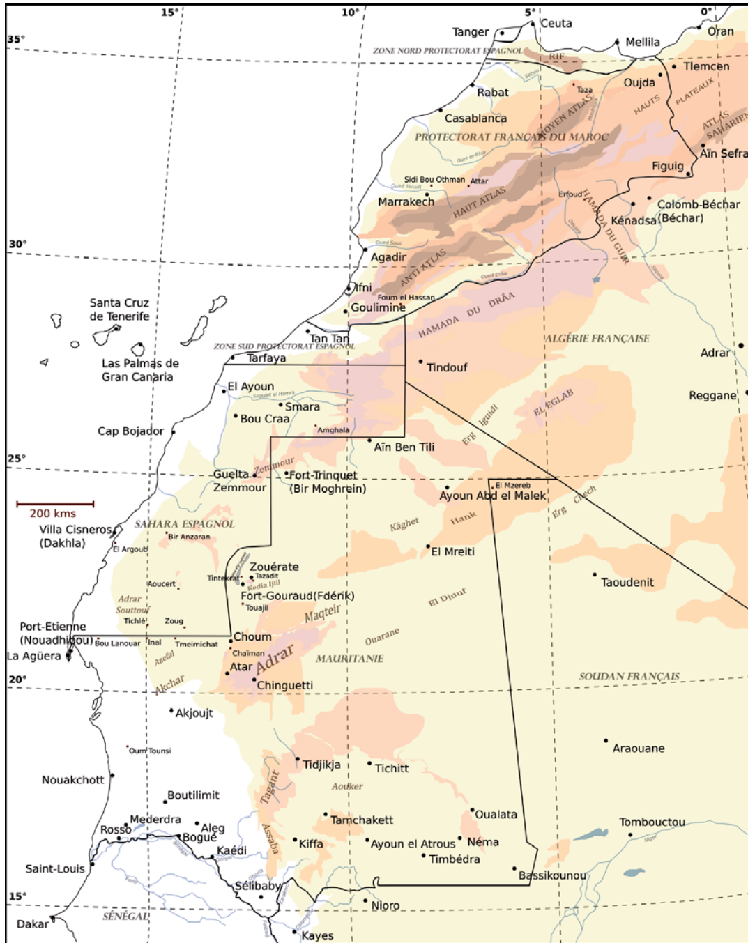
Carte 1. Le Nord-ouest saharien à la veille de l'indépendance marocaine