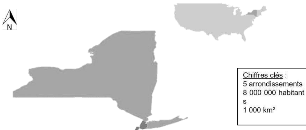
Figure 1. Carte de New York City et de ses cinq arrondissements (en gris opaque), représentée dans l'État de New York (en gris foncé)