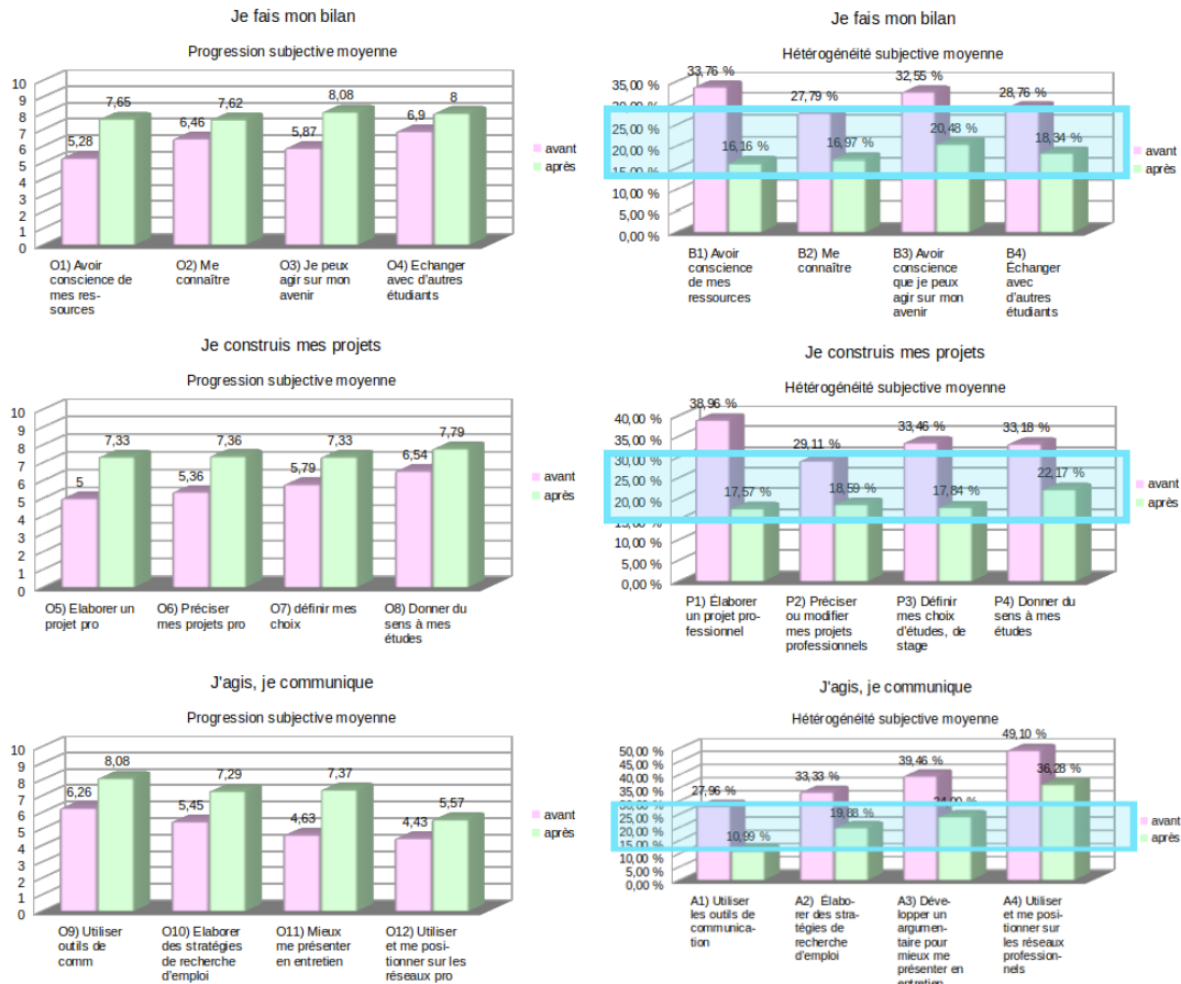
Fig 2: Progression et hétérogénéité subjective moyenne sur les différents objectifs du module

Les diagrammes des gains brut moyen (colonne gauche de tableau Fig 2) et le calcul des gains relatifs 1 (tableau Fig 3) montrent une progression importante sur les capacités des étudiants à faire leur propre bilan (+48,5% de gain relatif moyen), sur celle de construction de leur projet de vie (+44,5%) et sur leur capacité à agir et communiquer pour influencer sur leur projet (+37,75%) 2 .