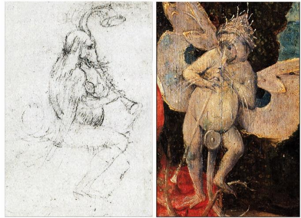
Éléphantaisie : Léonard de Vinci & Jérôme Bosch

Alors, peut-être qu'un jour une œuvre méconnue « à quatre mains », certifiée des deux maîtres, resurgira du fonds du cinquecento et viendra mettre un point d'orgue – en forme de clin d'œil à l'organistrum du panneau latéral du « Jardin des délices » - à cette collaboration picturale totalement inédite à ce jour.