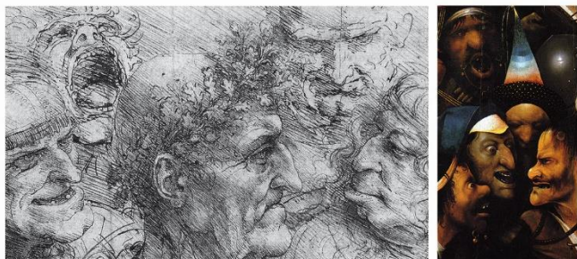
Visages grotesques : Léonard de Vinci & Jérôme Bosch

C'est durant son séjour vénitien en 1500 que Léonard de Vinci développe à partir des études physiologiques réalisées pour sa peinture murale de la « Cène » 13 , une série de caricatures singulières, dites « grotesques ». Celles-ci ont de toute évidence marqué l'esprit d'Albrecht Dürer qui au cours de son second séjour à Venise s'en inspire pour les visages de ses vieillards du « Christ parmi les docteurs » (1506). Jérôme Bosch semble en donner une libre interprétation, de peu postérieure à son séjour supposé à Venise, au revers du « Jugement dernier » (v.1505-1510) ou bien encore dans les profils grotesques des figurants qui encadrent la tête du Christ dans le « Portement de Croix de Gand » (v.1505-1510) 8 . Dans cette dernière œuvre, le contraste puissant entre la sérénité exprimée par le visage du Christ et la folie grotesque des visages de tous ceux qui l'entourent fait ressortir le caractère sublime du Christ, capable de résister à ce que nous appellerions aujourd'hui l'emprise de l'opinion publique ou la manipulation des médias. Comment alors, diriez-vous, et où – ailleurs que dans le berceau intellectuel et humaniste vénitien - ce peintre flamand a-t-il trouvé à la fin du quinzième siècle une approximation d'idées aussi modernes 14 .