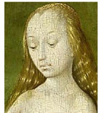
Visage : Léonard de Vinci & Jérôme Bosch