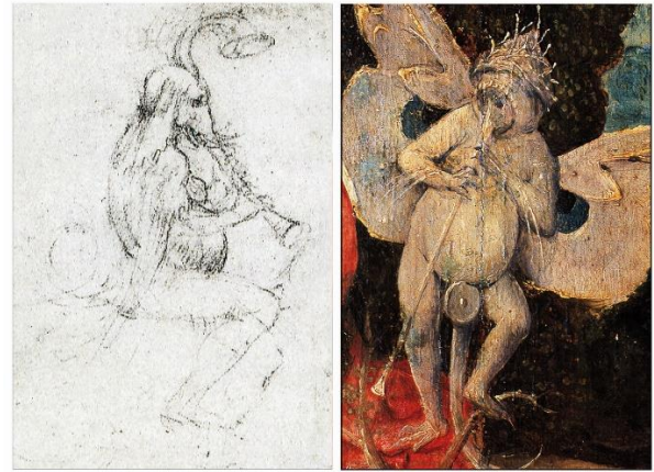
Éléphantaisie : Léonard de Vinci & Jérôme Bosch

Alors, peut-être qu'un jour une œuvre méconnue « à quatre mains », certifiée des deux maîtres, resurgira du fonds du cinquecento et viendra mettre un point d'orgue – en forme de clin d'œil à l'organistrum du panneau latéral du « Jardin des délices » - à cette collaboration picturale totalement inédite à ce jour.