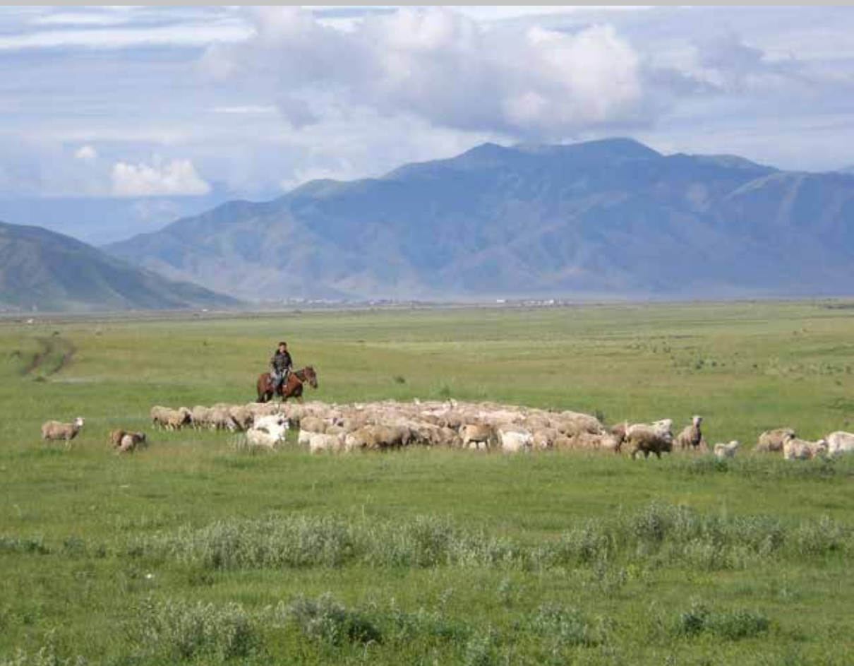
Surveillés par un berger à cheval, des moutons paissent sur une pâture estivale parsemée de fleurs (Kazakhstan, région d'Almaty, district de Rajymbek, juin 2012).