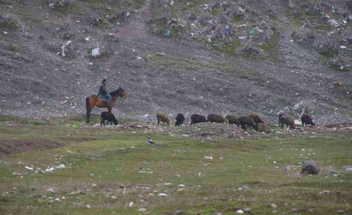
Surveillés par un berger à cheval, des moutons paissent sur une décharge aux résidus radioactifs, près d'un ancien combinat de traitement de l'uranium à Kara-Balta (Kirghizstan, région de la Čuj, district de Žajyl, février 2009).