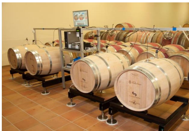
Fig 1 : Dispositif expérimental

indiquer que la dépression créée à l'intérieur du fût est fortement liée à l'humidité relative du chai (Fig 2). Plus le taux d'humidité augmente, plus la pression relative dans le fût diminue. Ceci est lié au gonflement du bois suite à l'augmentation de l'humidité relative qui augmente la pression mécanique aux inter-douelle : ceci a pour effet d'augmenter la pression de percolation aux inter-douelles. Sur cette première campagne d'essais, la dépression dans le ciel gazeux varie entre -10 et -40 mbar.