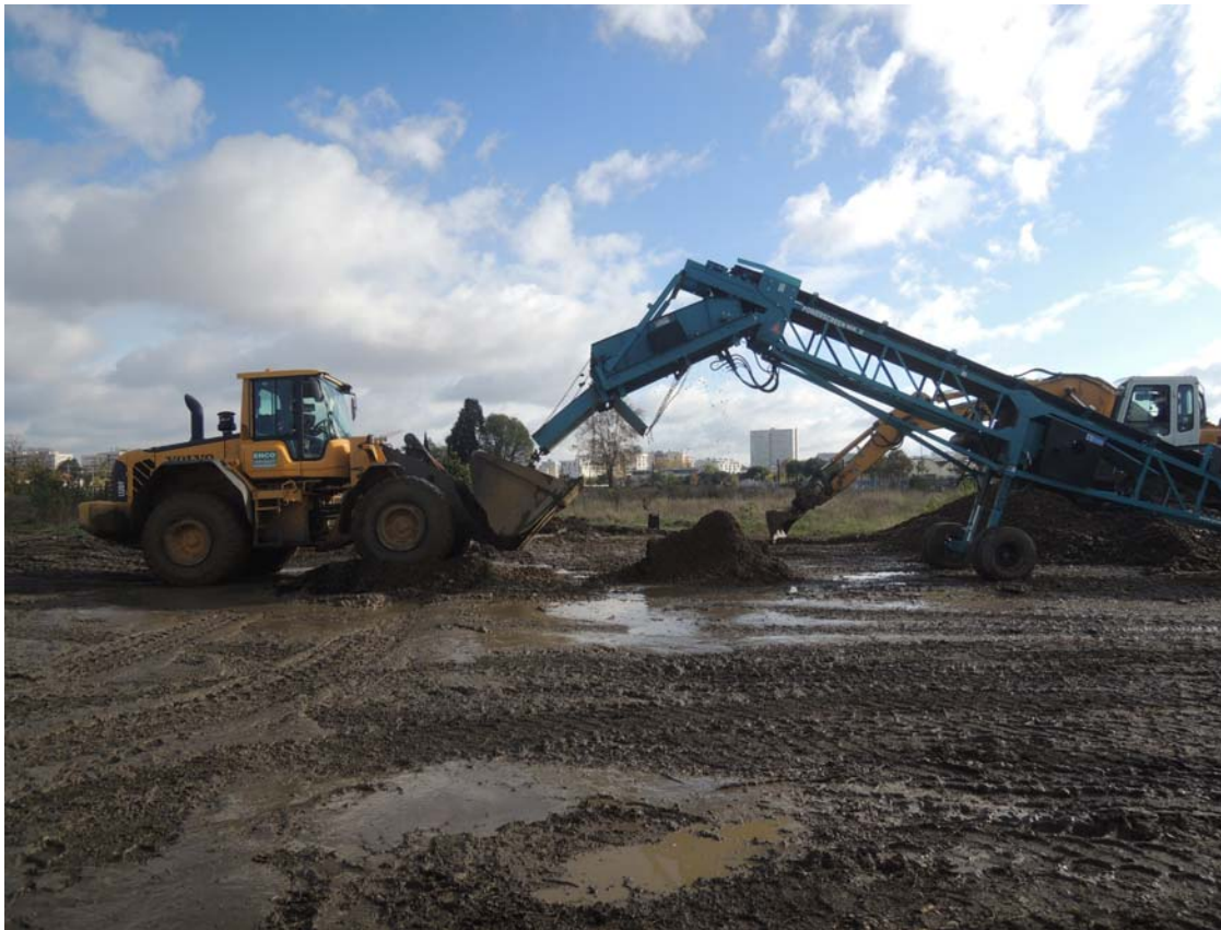
Sur le sujet crucial de la gestion des sols pollués des collaborations internationales sont mises en œuvre. Exemple du Réseau-Agriville qui implique des chercheurs du Gabon, du Pakistan et de la France en visite sur le site de la Cartoucherie.

De nombreux produits chimiques peuvent circuler ou s'accumuler dans les sols urbains (Galitskova et Murzayeva, 2016) et dans les cultures (Clinard et al., 2015). En raison de la complexité des mécanismes bio-physico-chimiques impliqués dans le transfert de substances dans les écosystèmes terrestres, les scientifiques peuvent rarement répondre simplement à des questions sur la pollution (Goix et al., 2015). La nécessité de pratiques plus respectueuses de l'environnement s'impose (Dumat et al., 2016).