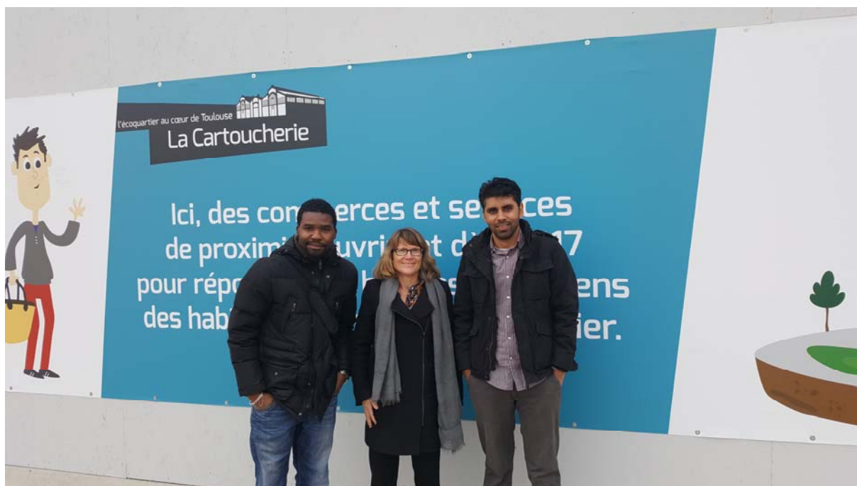
Le site de la Cartoucherie en plein cœur de Toulouse est une friche industrielle polluée aux métaux lourds qui a été décontaminée pour faire place à un éco quartier en 2016.

Ressource » a été aménagé dans le quartier de Fives à l'est de Lille pour permettre aux personnes le souhaitant de créer leur propre espace de culture. A l'avenir, d'autres espaces seraient également à créer afin de développer un réseau agricole au sein des villes.