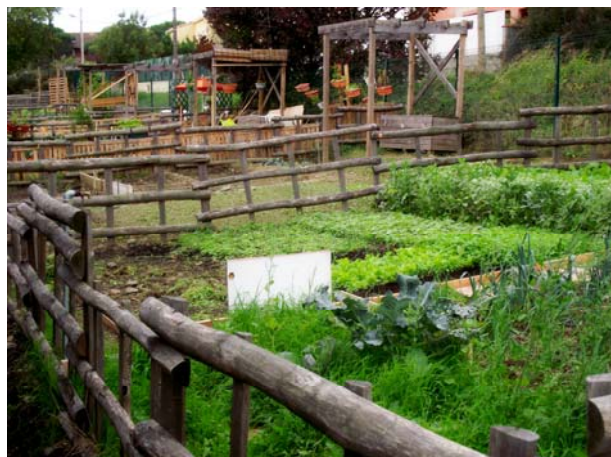
Les jardins collectifs de Monlong accueillent des populations de tous les pays qui n'hésitent pas à tester des pratiques de culture innovantes.

Longtemps considérée comme un phénomène de mode, l'agriculture urbaine s'installe progressivement en France et dans le monde. Aujourd'hui, bien plus qu'une simple tendance, l'AU devient une vraie prise de conscience, en renforçant en particulier les liens entre urbains et périurbains.