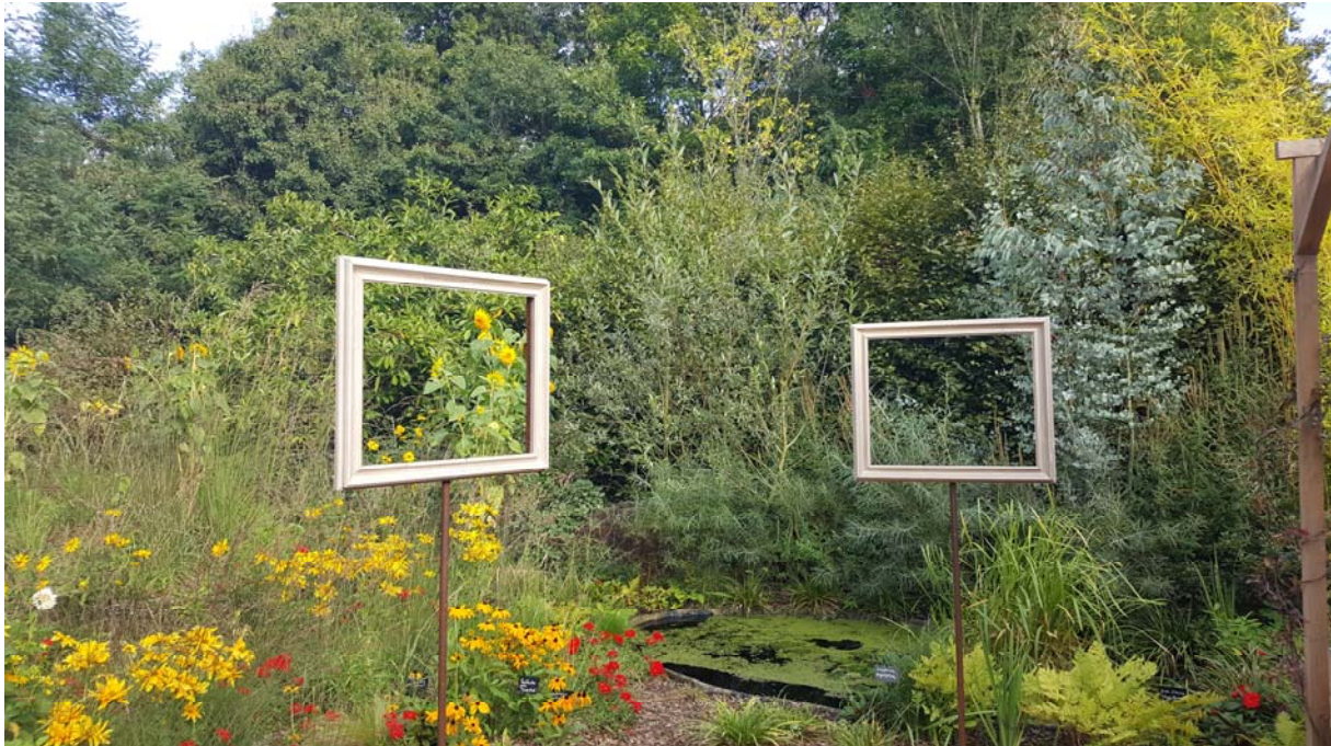
Le domaine de Chaumont sur Loire (41) est un site hybride qui allie beauté des paysages, innovations artistiques, formations à l'environnement. Les paysages sont mis en scène.

d'agriculture complètement insérées dans la ville dense ? Quels sont les projets et leurs auteurs qui soutiennent ces « délocalisations agricoles » ?