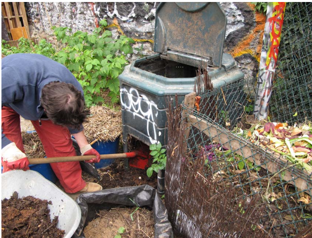
Pratique du compostage dans un jardin partagé du 18 e arrondissement à Paris.

des plantes, le développement des arbres et le trafic léger. Ainsi, ils doivent avoir une capacité portante, des propriétés agronomiques et une capacité de drainage adéquates. De plus, ils doivent se conformer aux restrictions environnementales pour empêcher les rejets de polluants dans l'environnement. Le programme national de recherche (SITERRE, 2011-16) financé par l'ADEME a été consacré à la construction de sols avec des déchets urbains pour l'écologisation des villes, comme alternative à la consommation de ressources naturelles. Les objectifs du programme étaient: (1) d'exprimer les propriétés attendues des sols qui pourraient remplir de façon optimale les principales utilisations des terres vertes en termes de fertilité, capacité portante et impacts environnementaux, (2) définir des indicateurs pertinents de fertilité du sol et (3) proposer des profils de conception de sol construits liés à l'utilisation des terres, (4) identifier et rapporter les déchets pouvant convenir à la construction du sol, (5) évaluer l'évolution des propriétés agronomiques des sols dans des conditions in situ, et (6) vérifier la sécurité des mélanges pour l'environnement et la santé des habitants.