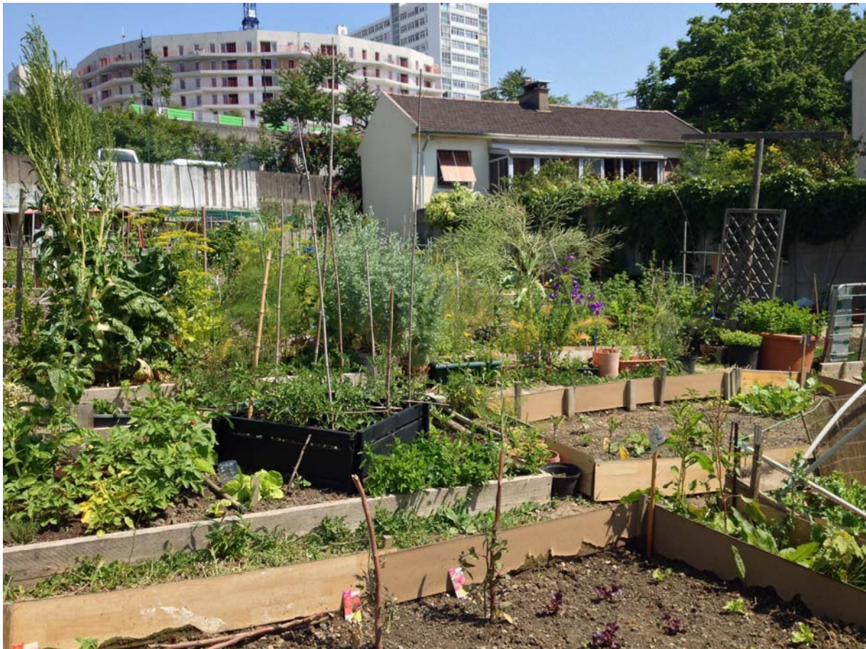
Des jardins partagés à Bagnex dans les Hauts-de-Seine.

L'activité processus d'interaction intelligente d'un opérateur avec les exigences de sa tâche, les contraintes de l'environnement, son état interne, ses objectifs individuels, résultent d'une construction personnelle à celui-ci. Entretien semi-directifs avec les jardiniers, observations, et recueil de verbatims. Les principaux résultats ont montré une catégorisation des jardiniers. Certains recherchent à cultiver des végétaux « bons pour la santé », d'autres viennent aux jardins pour faire des rencontres et s'affirmer, et enfin d'autres y voient le moyen de rester en forme. Toutefois, ces diverses facettes sont en forte interaction. Par ailleurs, les jardiniers seniors s'ils viennent aux jardins pour profiter d'une certaine dynamique, induisent également par leur présence des changements dans les pratiques des autres catégories de jardiniers : les