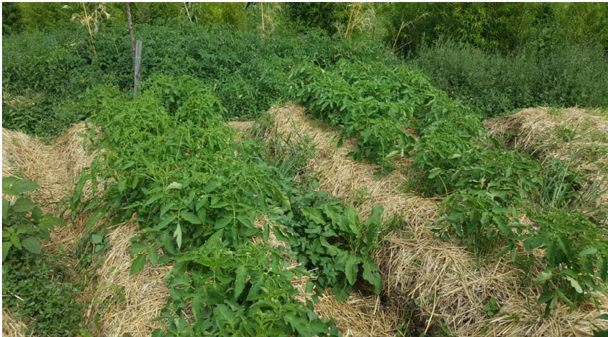
L'agroécologie, l'agriculture biologique et la permaculture sont plus particulièrement pratiquées sur les sites d'AU pour éviter l'exposition des populations aux substances chimiques. Dans une exploitation en permaculture à Revel (Haute-Garonne) des cultures de tomates sont réalisées sur des buttes organisées en mandala pour favoriser l'exposition au soleil.

la ville et de la dynamique de l'espace public. Le colloque international AU-2017 a favorisé les échanges socio-scientifiques entre les chercheurs et les autres acteurs (agriculteurs, élus, etc.) relatifs aux recherches et techniques développées pour une agriculture urbaine durable : agro-écologie, agriculture biologique et agricultures innovantes en sol ou en hors sol.