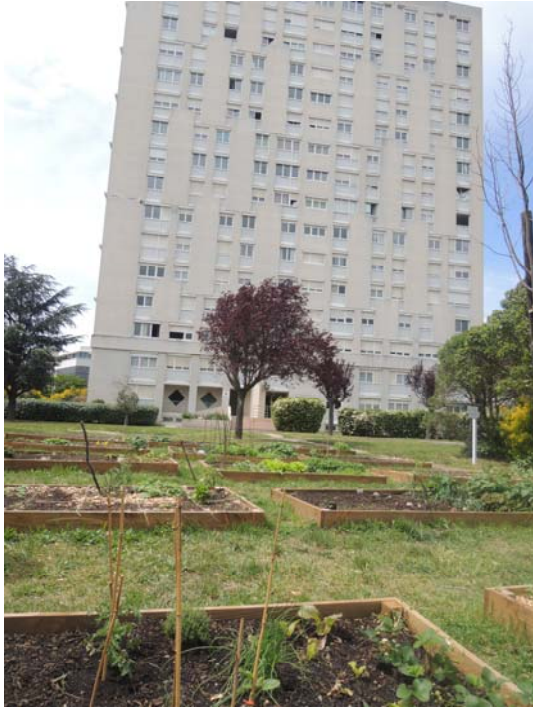
Les espaces verts des habitats collectifs sont de plus en plus remplacés par des paysages comestibles par exemple des jardins en pied d'immeuble (Toulouse Habitat).