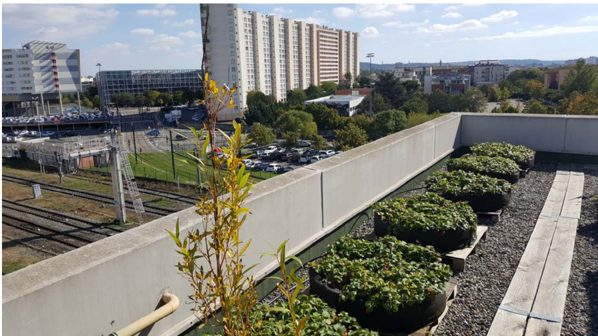
Des potagers sur les toits se multiplient dans les villes du monde. A Toulouse la clinique Pasteur a aménagé des cultures variées pour agrémenter les repas des patients et favoriser la communication sur l'alimentation comme vecteur de santé. Photo : Camille Dumat, 2018

ville et la campagne (Poulot, 2014). Ailleurs (New-York, Singapour) parce qu'il n'y a plus de place à terre et plus rarement chez nous, les agricultures urbaines prennent de la hauteur. Elles s'installent alors sur les toits, à Montréal avec la Lufa Farm. Le jardin installé en 2013 sur le toit de la Clinique Pasteur à Toulouse fait parti des rares expériences françaises d'agriculture urbaine « suspendue ». 500 m 2 de surface potagère recouvrent la toiture de cet établissement de santé spécialisé en cardiologie et engagé dans une politique de développement durable.