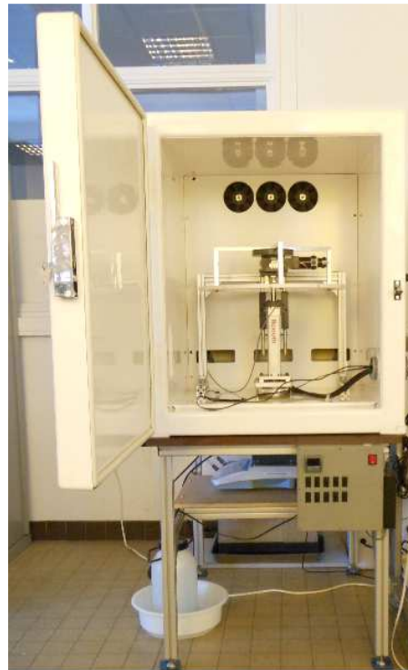
Fig. 1 : Dispositif expérimental