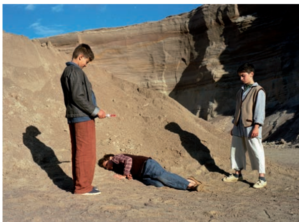
2. Eija-Liisa Ahtila, Where is Where ? , capture extraite de l'installation vidéo, Finlande, 2009.