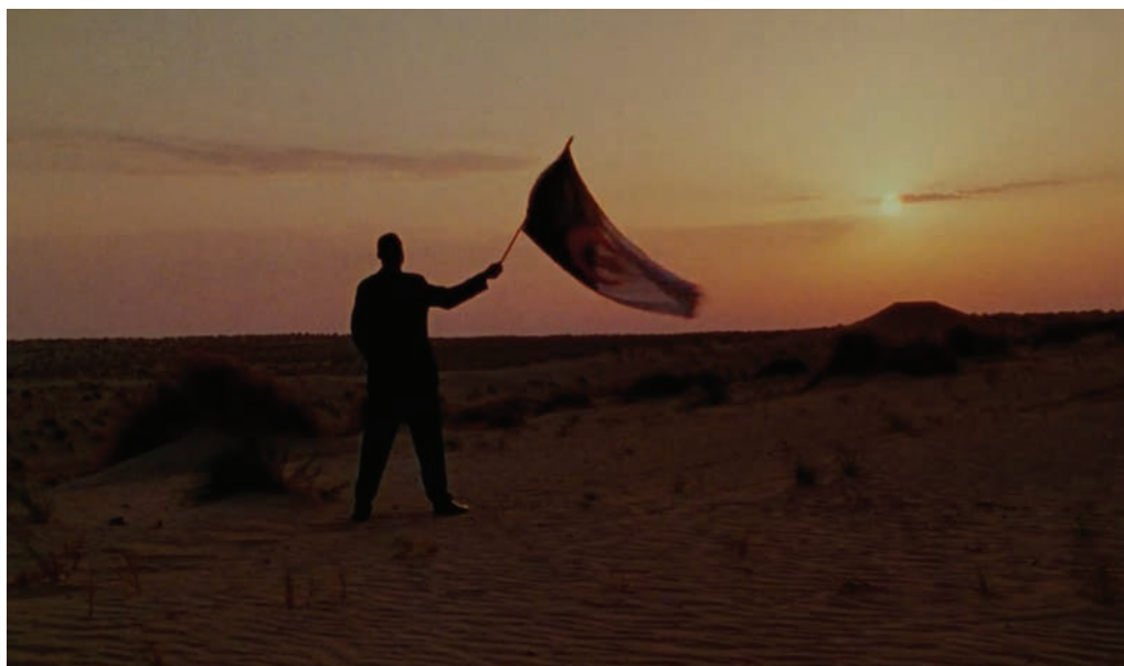
1. Isaac Julien, Frantz Fanon. Black Skin, White Mask , capture extraite du documentaire, Grande-Bretagne, 1996.

par ses écrits. Au printemps 1995, l'exposition « Mirages: Enigma of Race, Difference and Desire », à Londres, se propose de réunir de nombreux intellectuels et artistes contemporains autour de la figure tutélaire de Frantz Fanon 10 . De cette exposition naît un colloque dont les actes sont publiés sous le titre The Fact of Blackness. Frantz Fanon and Visual Representation . Articulée essentiellement autour de la question raciale et sexuelle, la publication propose de penser la représentation visuelle dans une perspective décoloniale, autour de la notion de Blackness 11 . Le titre de ces actes reprend en effet la traduction anglaise du premier chapitre de Peau noire, masques blancs ; mais de la version originale « l'expérience vécue du noir » à sa traduction anglaise en « fait d'être noir », la dimension existentialiste, qui mettait l'accent sur la construction de soi par l'expérience vécue, semble avoir été évacuée. Entré dans la postérité pour son travail fondateur sur le racisme systémique, mais aussi pour sa contribution et sa pensée forgée en situation de guerre décoloniale, Fanon est également l'un des acteurs majeurs de l'émancipation en Algérie, ce que cette exposition et cette publication semblent éluder, pour se centrer sur l'apport de Fanon dans la construction des pensées critiques développées par les post-colonial studies et les cultural studies .