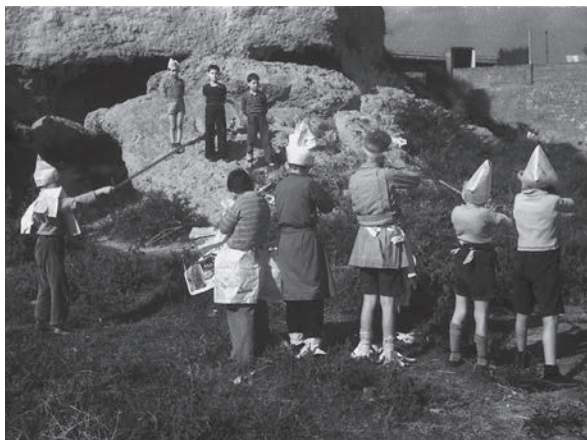
3. Agustí Centelles, Jeux d'enfants à Montjuïc, Barcelone, 1936