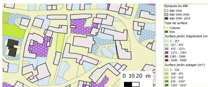
Figure 3. Extrait de la carte des jardins de Marigny (centre-bourg).

Pour coconstruire la cartographie, les chercheurs ont d'abord proposé des éléments à cartographier (taille du jardin, localisation, types de surface, etc.), que les commanditaires ont complété à partir de leur connaissance du territoire : ils ont par exemple ajouté des particularités locales méconnues des chercheurs, comme les chambeaux, des jardins non attenants à l'habitation, utilisés par leur propriétaire ou par des locataires pour du maraîchage en raison de la qualité de leur terre.