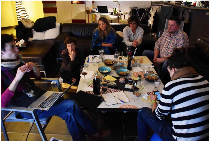
Figure 4. Une réunion de travail au domicile de l'un des commanditaires

L'hospitalité des commanditaires (qui hébergent les chercheurs) crée une relation qui dépasse le cadre formel de l'échange scientifique. Elle construit un lien affectif et une confiance réciproque. Sur un plan didactique, tout comme l'affectivité joue un rôle dans l'apprentissage des élèves à l'école (Espinosa, 2003), nous pensons que la convivialité et le plaisir à être ensemble favorisent la confiance, l'expression bienveillante de questions et de critiques, les efforts et les petites prises de risque, autant d'éléments qui facilitent un apprentissage où chacun s'approprie à sa manière des savoirs ou des compétences, sans crainte d'être jugé. Cette connaissance mutuelle qui se construit dans la durée vient renforcer la collaboration.