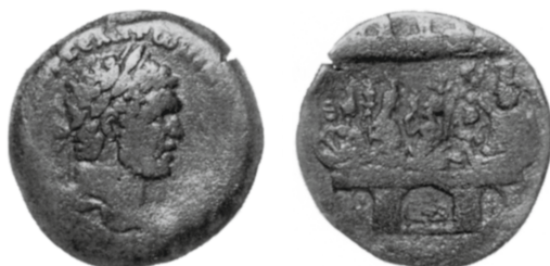
Figure 6 - Alexandrie. Drachme de Caracalla : Cologne (= Geissen 2294).

l'empereur. Le revers de cette monnaie, qui porte le n° 2294 dans le catalogue 8 , est décrit ainsi : «Gebäude mit Göttern. In der Mitte von r. nach l.: Sarapis sitzt nach l., hält Kranz über vor ihm n. l. sitzenden Harpokrates (mit Geißel); davor sitzt Isis mit Kopfschmuck r., i.d.L. Szepter, hält mit d.R. Uraeus; hinter ihr sitzt Demeter mit Kalathos u. Fackel i.d.R.n.r.; ganz l. sitzt Hermanubis mit Caduceus r.; alle sitzen auf einem Lectisternium; darunter in drei Nischen: l. u. r. je eine stehende Figur mit Szepter (?), i. d. M. ruht Tyche auf Lectisternium n. l., hält Steuerruder u. stützt den Kopf; Datum unleserlich.» Le rapprochement est fait par l'auteur avec les exemplaires de la collection Dattari, de Londres et d'Alexandrie. Le motif, très proche de celui de la monnaie de Londres, se distingue assez nettement de celui de la monnaie d'Alexandrie.