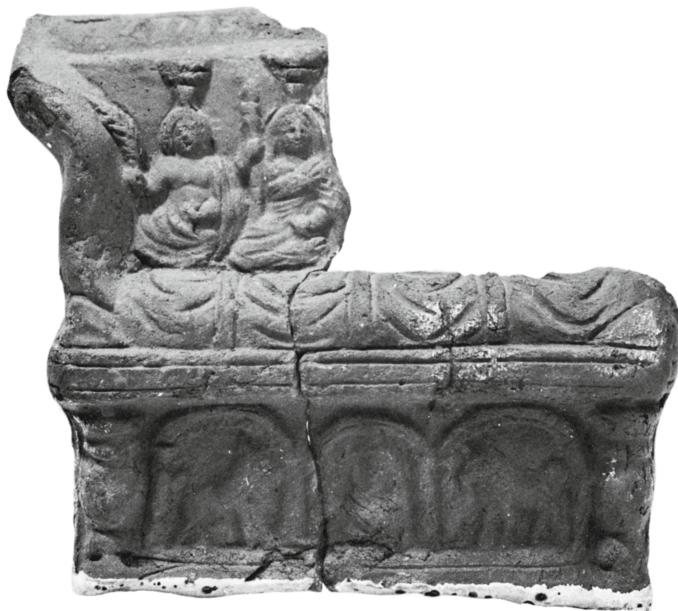
Figure 14 - Égypte. Tirelire en terre cuite : Musée égyptien, Le Caire 27163 (= Dunand, Religion populaire , 1979, pl. CXXVIII.368).