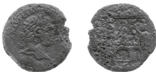
Figure 1 - Alexandrie. Drachme de Caracalla, an 23 : Londres 1864,1118.989 (= BMC Alexandria 1478).

qu'il décrit ainsi 2 : « ... ΘΕΟΝ The entrance of an edifice, having three doorways; in the central one, which is broader than the others, is seen a chariot, l.; in door, on l. two figures; in door on r., Nike? r.; upon the building, five figures, Sarapis recumbent, l., wears modius, r. arm outstretched, in l. scepter, Harpokrates, l., squatting, his r. hand to his mouth, in l. lotus-bud, Isis recumbent, l. looking r., crowned with horns disk and plumes, in l. scepter; similar female figure, in same attitude, Tyche? In l. cornucopiae; and Hermanubis recumbent l. holds in r. caduceus; above, what appears to be the end wall of the building, crenellated. In ex., [L] ΚΓ. » L'exemplaire, abîmé, ne laisse guère deviner quels éléments de la scène figuraient sur le tiers gauche du revers.