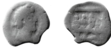
Figure 7 - Alexandrie. Diobole de Commode : Paris FG 2770 (= Bakhoum, Dieux égyptiens , 1999, pl. XXII.119).