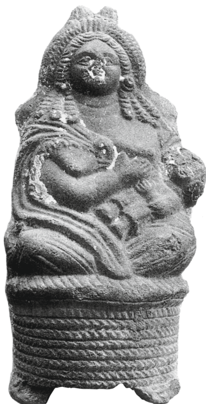
Figure 11 - Égypte. Terre cuite d'Isis sur la corbeille : Louvre, Paris (= Dunand, Catalogue des terres cuites gréco-romaines d'Égypte , 1990, p. 143.378).