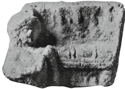
Figure 34 - Héracléopolis Magna. Statuette de terre cuite : Petrie, Roman Ehnasya , 1904, 1905, pl. XLVII.45.