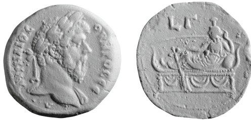
Figure 10 - Alexandrie. Drachme de Marc Aurèle et Lucius Verus, an 3 : Berlin (= RPC IV 16194).

s'appuyant sur un coussin et tenant de la main droite un gouvernail 12 . Dans les deux autres niches, plus petites, symétriques, prennent place à gauche Osiris de Canope coiffé du pschent et, à droite, Isis de Ménouthis coiffée du basileion , figurés sous l'aspect de vases pansus 13 placés chacun sur une couronne florale et tournés vers le centre de la composition.