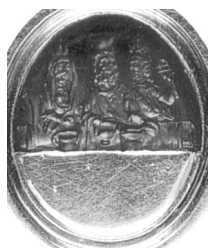
Figure 29 - Sarde dans une bague moderne : British Museum, Londres 1214 (= Veymiers, Sérapis sur les gemmes , 2009, pl. XXI.V.BD 1).