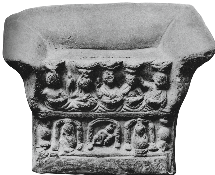
Figure 13 - Égypte. Tirelire en terre cuite : Antikensammlung, Berlin 31275 (= Lederer, Deutsche Münzblätter , 1936, pl. 166.1).