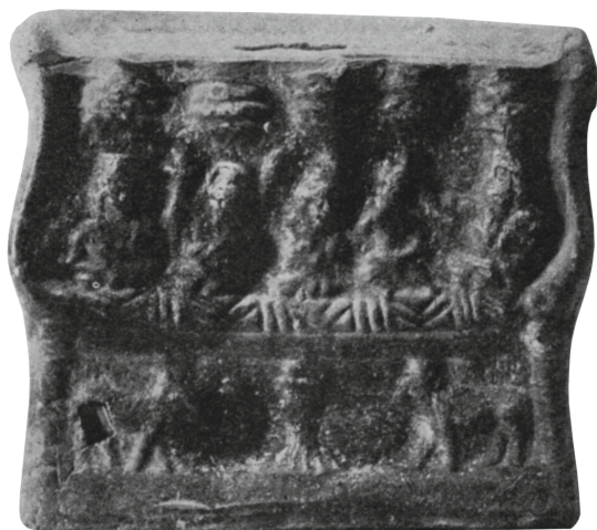
Figure 15 - Égypte. Tirelire en terre cuite : Staatliche Antikensammlungen, Munich 5614 (= Lederer, NC , 1938, p. 78).

Une troisième tirelire présente le même schéma iconographique. Publiée par Lederer en 1938, elle est conservée aux Staatliche Antikensammlungen de Munich (figure 15) 22 . Très semblable à la précédente pour ce qui est du registre principal, elle s'en distingue par l'absence de niches au registre inférieur. La tirelire, ou plutôt le moule qui l'a engendrée étant fort usé, la scène qui y figure ne se laisse pas aisément déchiffrer. Lederer, suivant l'interprétation de Hans Diepolder, alors directeur du Museum Antiker Kleinkunst 23 de Munich, proposait de reconnaître au centre un thymiaterion ou un autel entouré de deux bovidés (Hathor, Apis ?) tournés vers lui.