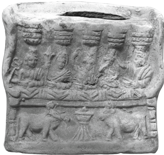
Figure 16 - Égypte. Tirelire en terre cuite : Vente Pierre Bergé & associés, Paris, 1 er décembre 2011, lot 170.