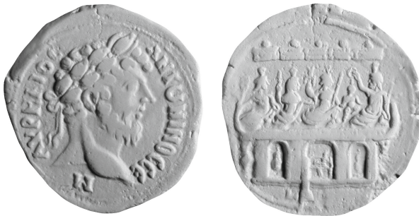
Figure 3 - Alexandrie. Drachme de Marc Aurèle, an 8 : Berlin 136/1936 (= Lederer NC, 1938, pl. I.6).