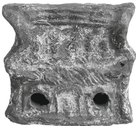
Figure 20 - Égypte. Lampe en terre cuite : Musée Bénaki, Athènes 12845. Inédite.

Les tirelires ne sont pas les seules terres cuites à présenter un tel schéma iconographique. On retrouve en effet nos cinq dieux sur plusieurs lampes plastiques égyptiennes. Nous en connaissons au moins huit, appartenant à deux modèles différents. Les premières se présentent comme des lampes à deux becs de forme quasi cubique et nous sont connues par quatre exemplaires. Celle qui se rapproche le plus, par son décor, des tirelires, conservée au Musée Bénaki, est inédite (figure 20) 29 . Au registre principal, on retrouve probablement les cinq mêmes divinités 30 et au registre inférieur, trois autres dans des niches. La niche centrale, plus petite que les deux autres, semble occupée par une divinité en buste, qui pourrait être identifiée à Osiris de Canope ou Isis de Ménouthis reposant sur un coussin floral. De part et d'autre, on reconnaît deux bovidés, dont l'identification ne peut guère être précisée, les deux trous de la lampe ayant été percés en plein sur les deux figures.