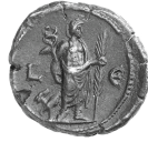
Figure 33 - Alexandrie. Tétradrachme de Philippe II, an 5 : vente Künker 216, 8 octobre 2012, lot 1210.

doute comme le pendant de la déesse Isis, avec laquelle elle ne se confond dès lors pas. On peut même se demander, vu le nombre très important de documents offrant les images associées d'Hermanubis et de Déméter, dans quelle mesure, aux II e -III e siècles apr. J.-C., ils ne formeraient pas, à Alexandrie tout au moins, un véritable couple divin, frugifère et salvateur, faisant pendant au couple isiaque.