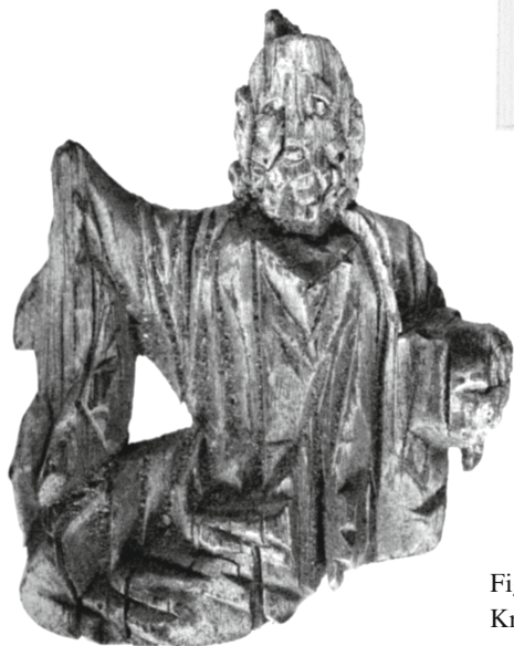
Figure 31 - Oxyrhynchos. Applique en bois : Kraus, JDAI , 1979, p. 567.1.