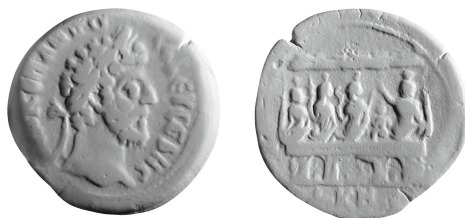
Figure 9 - Alexandrie. Diobole de Commode, an 28 : Oxford (= RPC IV 15461).

La mise en série de ces neuf exemplaires appelle plusieurs observations 11 . En l'an 8 de Marc Aurèle, en l'an 28 de Commode, lors du règne de Septime Sévère puis en l'an 21 et en l'an 23 de Caracalla, l'atelier d'Alexandrie frappe une émission montrant au revers une scène de « banquet divin ». La composition iconographique est toujours la même, à quelques détails mineurs près (forme des attributs, position des mains, taille des éléments du registre supérieur), conditionnés en partie par le module inférieur des dioboles de Commode et Septime Sévère. Elle se lit sur trois registres.