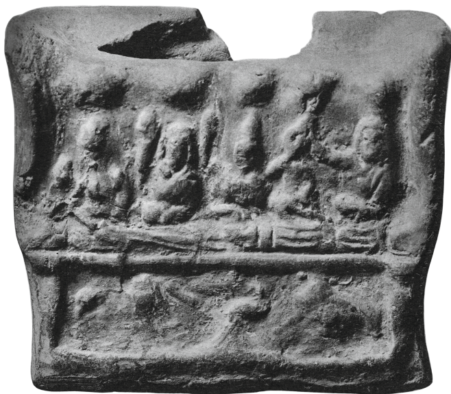
Figure 17 - Égypte. Tirelire en terre cuite : Lederer, Deutsche Münzblätter , 1936, pl. 167.1.

le centre de la scène soient de nouveau des bovidés, mais pas nécessairement des Apis, comme nous l'avons déjà noté. Et plutôt qu'un bateau, c'est sans doute un autel enflammé qu'il faut identifier au centre, l'ensemble étant à rapprocher directement du décor du registre inférieur des deux tirelires précédentes.