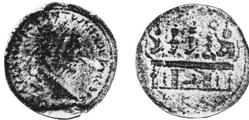
Figure 8 - Alexandrie. Drachme de Caracalla, an 21 : (= Dattari-Savio 9782).