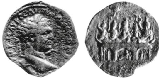
Figure 5 - Alexandrie. Drachme de Caracalla, an 21 : Alexandrie (= el-Mohsen el-Khachab, JEA , 1961, pl. X.3).