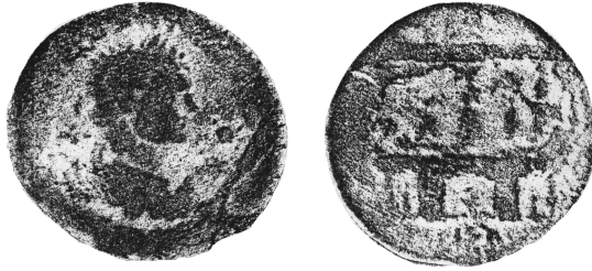
Figure 2 - Alexandrie. Drachme de Caracalla, an 21 : Dattari 4076 (= Dattari-Savio pl. 22).