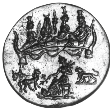
Figure 12 - Volynsk (Ukraine). Hématite : Ermitage, Saint-Pétersbourg Ж 6728 (= Veymiers, Sérapis sur les gemmes , 2009, pl. 59.V.CD 1).