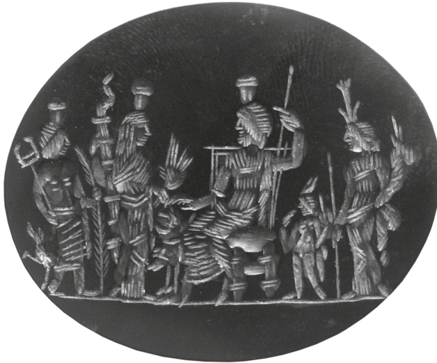
Figure 32 - Intaille de pierre noire : Musée national archéologique, Athènes 2743 (= Veymiers, Bibliotheca Isiaca II, 2011, pl. 12.V.CB 16).

Car ce sont bien les dieux d'Alexandrie qui participent à ces lectisternes en compagnie de la population locale 58 . À la triade Sarapis-Isis-Harpocrate s'ajoutent Hermanubis et Déméter pour constituer un quintette que l'on retrouve sur plusieurs autres documents d'Égypte, tels cette intaille de pierre noire provenant probablement d'Alexandrie ou de ses environs, conservée au Musée national archéologique d'Athènes et publiée par R. Veymiers (figure 32) 59 .