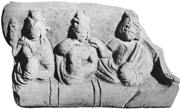
Figure 22 - Égypte. Lampe (?) en terre cuite : Lederer, Deutsche Münzblätter , 1936, pl. 167.2.