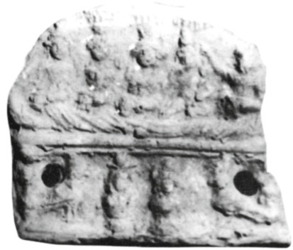
Figure 21 - Égypte. Lampe en terre cuite : Musée gréco-romain, Alexandrie 25679 (= Tran tam Tinh, Jentel, Corpus des lampes à sujets isiaques , 1993, pl. 9.32).

corne d'abondance de sa main gauche et Isis semble brandir un sistre 32 de la main droite. Plus originale, et à notre connaissance unique parmi la documentation publiée, est la composition qui orne le registre inférieur. Quatre figures sont représentées. Au centre, de face, sont les images, à gauche, d'Isis de Ménouthis, et à droite, d'Osiris de Canope. De chaque côté se tient un faucon debout, tourné vers le centre, celui de gauche coiffé de la couronne rouge de Basse Égypte ( decheret ), celui de droite coiffé de la couronne blanche de Haute Égypte ( hedjet ). Sur le dos des faucons s'ouvre un trou rond pour la mèche.