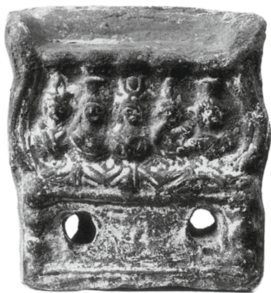
Figure 23 - Égypte. Lampe en terre cuite : Louvre, Paris E 14371 (= Dunand, Catalogue des terres cuites gréco-romaines d'Égypte , 1990, p. 177.483).

Les deux dernières lampes, moins richement illustrées, sont conservées au Musée du Louvre 33 (figure 23) et au British Museum 34 (figure 24). Au registre supérieur apparaissent les images de cinq divinités en buste, de face, posées sur une draperie, et chacune coiffée de sa couronne caractéristique (de droite à gauche, calathos , pschent , basileion , calathos et atef ). S'il faut en effet, à la suite de Fr. Dunand, 35 reconnaître l' atef sur la tête de la divinité placée à l'extrémité gauche de la klinè – ce n'est en effet clairement pas un calathos –, il pourrait s'agir davantage d'Osiris que d'Hermanubis. Déméter est figurée voilée, tandis qu'Isis porte le nœud sur la poitrine. Le registre inférieur est vierge de toute représentation.