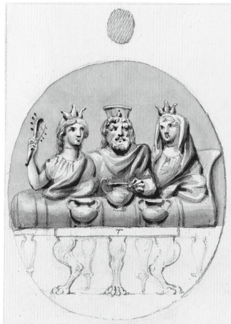
Figure 30 - Dessin à l'encre : British Museum, Londres, 2010,5006.1418.