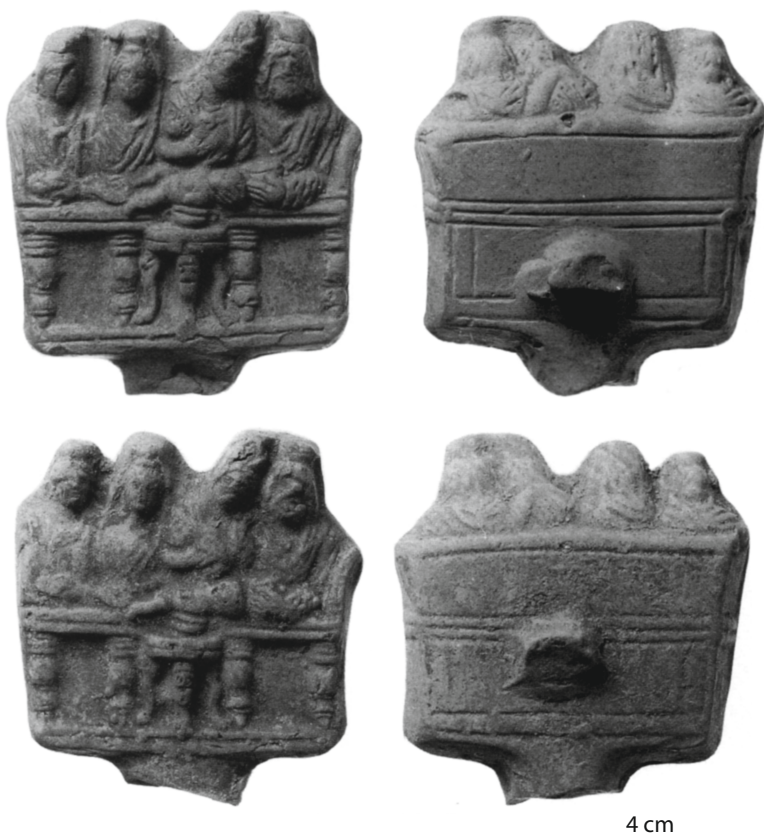
Figures 26-27 - Rome. Anses de lampes en terre cuite : Antiquarium del Museo Nazionale Romano 380116 et 380119 (= Pavolini, Tomei, Lucerne isiache dalla Domus Tiberiana , 1994, p. 108-109).

(figures 26-27) 38 . Cinq dieux y sont figurés : Sarapis, qui semble poser la main droite sur l'épaule droite d'Isis et tient un récipient de la main gauche ; Isis, qui pose affectueusement la tête sur l'épaule de son parèdre 39 . porte sa main droite sur sa