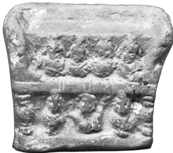
Figure 19 - Égypte. Tirelire en terre cuite : Museum für Kunst und Gewerbe, Hambourg 1989.1000 (= Götter, Gräber & Grottesken , 1991, p. 102.146).