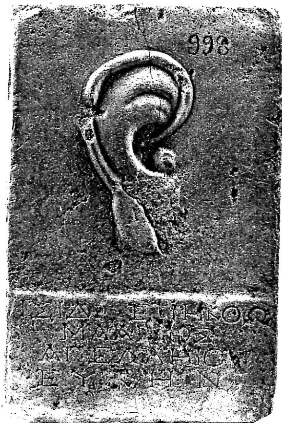
Iseum et Serapeum 17