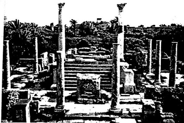
Iseum et Serapeum 9