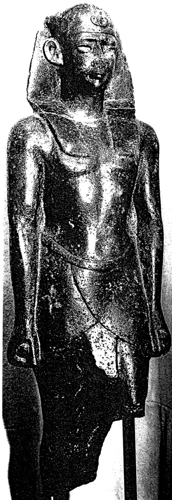
Iseum et Serapeum 21