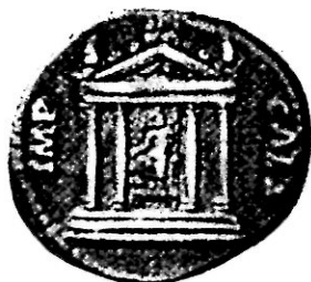
Iseum et Serapeum 15