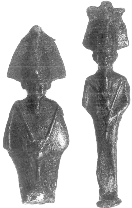
Vus de face