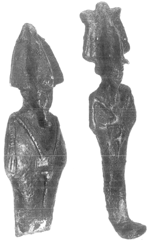
Les deux Osiris de Wanquetin