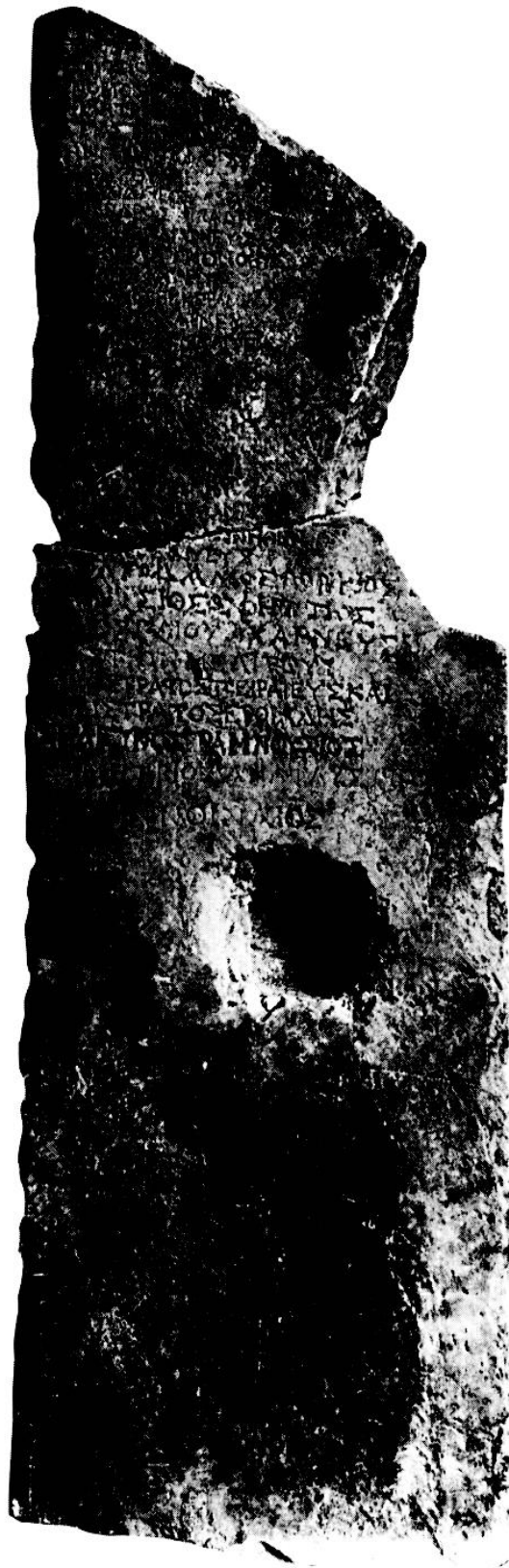
Fig. 1. ID 2610 (cliché EFA).