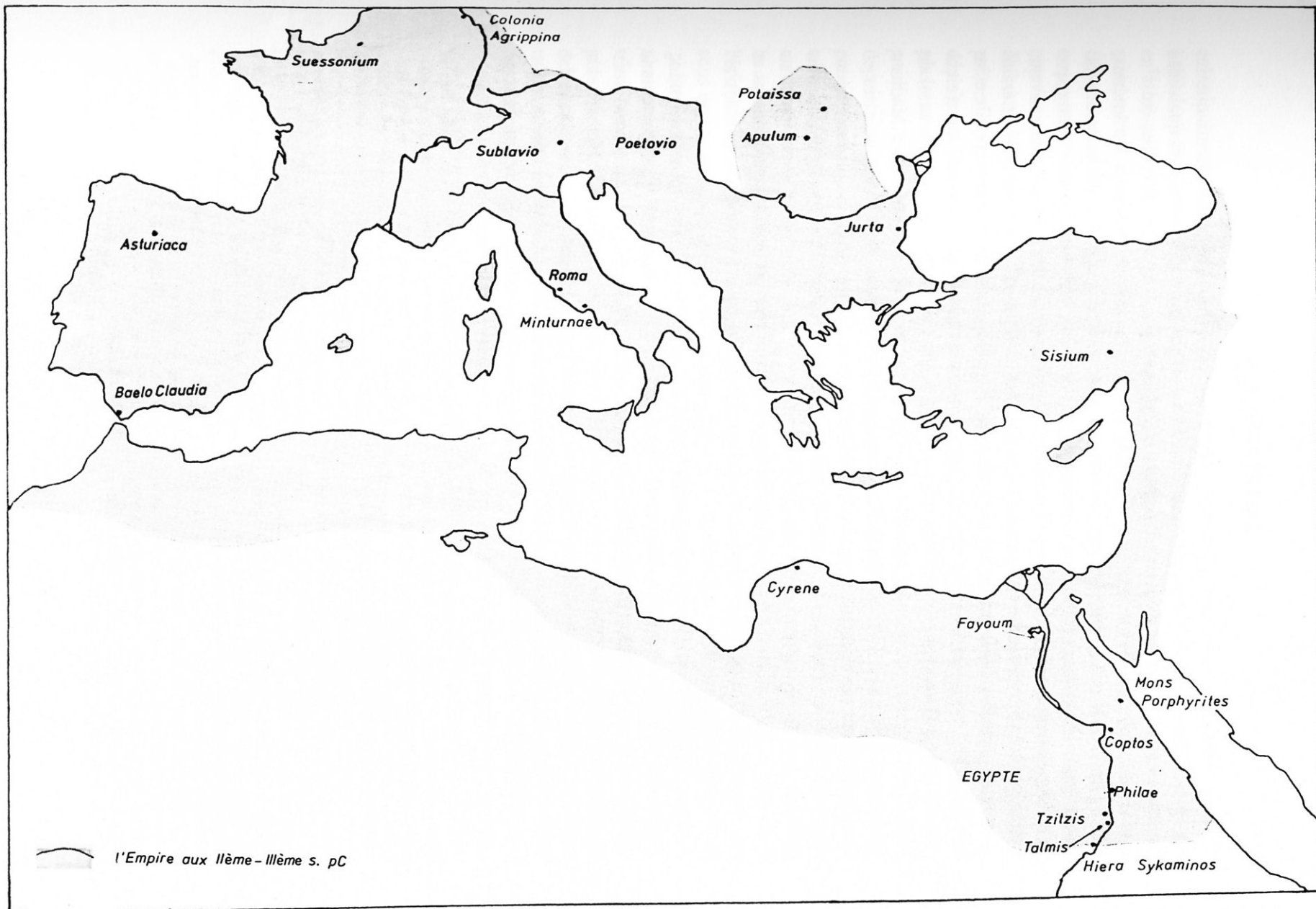
Localisation des épiscôpes