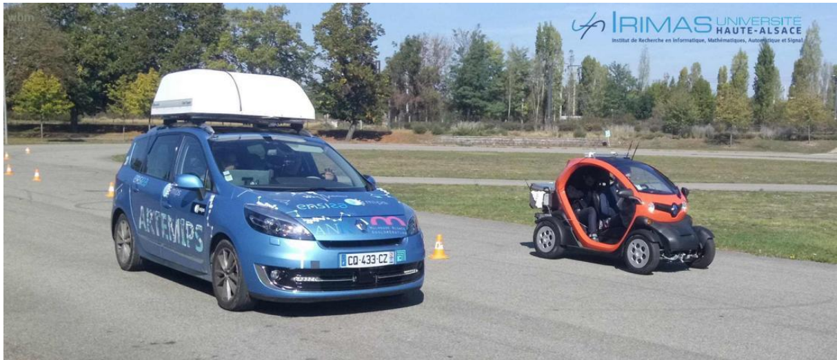
Figure 2 : Vue d’ensemble des deux prototypes de véhicule autonome de l’IRIMAS. Au premier plan « ARTEMIPS » et au second plan « POCHETTE ». ARTEMIPS est un véhicule autonome équipé pour prendre en charge à son bord une personne en situation d’handicap (travaux réalisés dans le cadre du projet SIMPHA). POCHETTE est un véhicule électrique léger de petit gabarit permettant de valider les concepts à l’aide d’une instrumentation bas coût et peu encombrante.

Cette architecture de commande a été mise en œuvre sur les prototypes de véhicule autonome de l’Institut de Recherche en Informatique, Mathématiques, Automatique et Signal (IRIMAS) de l’Université de Haute-Alsace présentés sur la Figure 3.