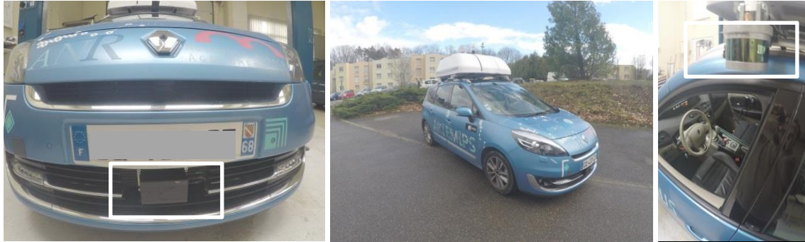
Figure 3 : Le véhicule ARTEMIPS de l'IRIMAS. Détail de quelques équipements pour la perception de la conduite autonome. A gauche, face avant du véhicule avec un télémètre laser à longue portée (150 mètres) au-dessous de la plaque d'immatriculation. Au milieu, une vision d'ensemble du véhicule. A droite, le poste de contrôle avec le volant instrumenté pour une conduite autonome et à l'extérieur dans la partie supérieure, un télémètre laser à courte portée (50 mètres).

Par ailleurs, les capteurs embarqués aujourd'hui dans le véhicule autonome sont dits « intelligents » car ils ne fournissent pas seulement une mesure brute de l'information mais sont assortis d'une brique logicielle embarquée capable de réaliser une première phase de traitement de cette information. Certains capteurs permettent, par exemple, de déterminer la distance entre le véhicule et un obstacle mais aussi la nature de l'obstacle détecté (piéton, cycliste, véhicule, camion, etc.). Les systèmes de vision, quant à eux, utilisent une voire plusieurs caméras (caméras multi-vues) afin de délivrer une information sur la profondeur de la scène 30 ou d'effectuer une reconnaissance des éléments de la scène (panneaux de signalisation, etc.). Toutefois, plus la vitesse du véhicule augmente, plus la détection des éléments doit se faire rapidement. Actuellement, cette détection peut être réalisée en temps réel conformément aux exigences de la brique logicielle, mais cela est uniquement vrai pour certains objets bien définis (voitures, piétons, adultes, etc.) et en considérant des taux de détection variable d'une situation à l'autre. Si le taux de reconnaissance va sans aucun doute augmenter dans les années à venir, le défi porte encore sur la détection d'éléments de petit gabarit pouvant apparaître soudainement sur la scène (par exemple un enfant qui traverse la route en courant, etc.).