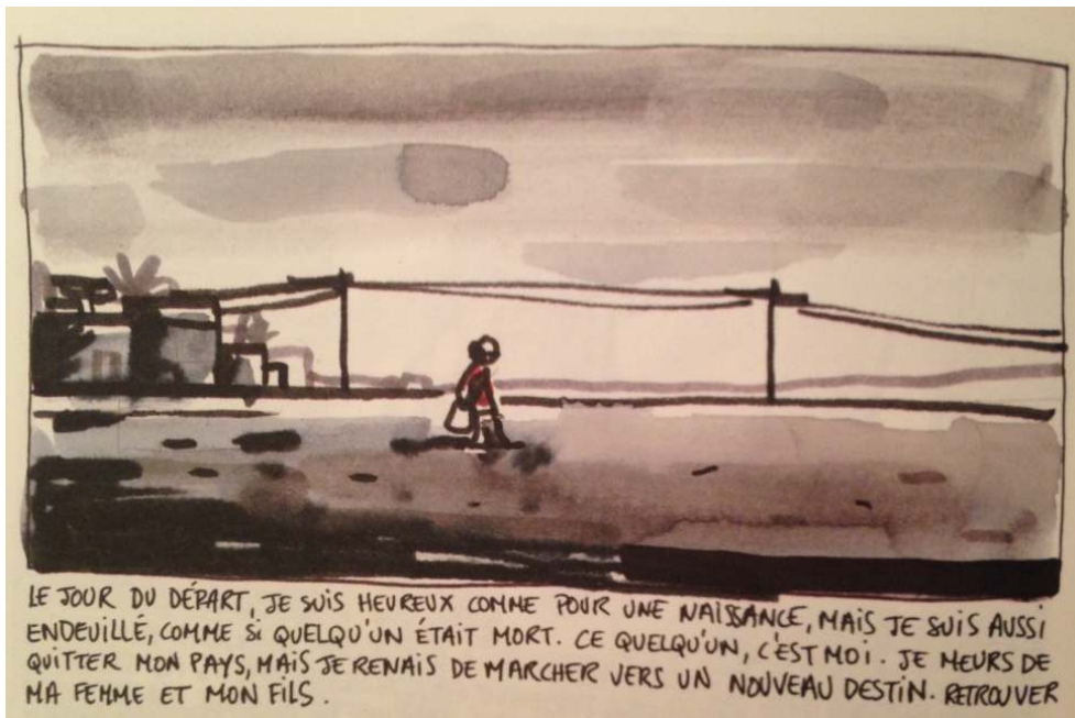
Illustration n° 2 : Le jour du départ d'Alpha.

Extrait de : Bessora (auteur) ; Barroux (illustrateur) (2014) Alpha, Abidjan-Gare du Nord , Paris, Gallimard.