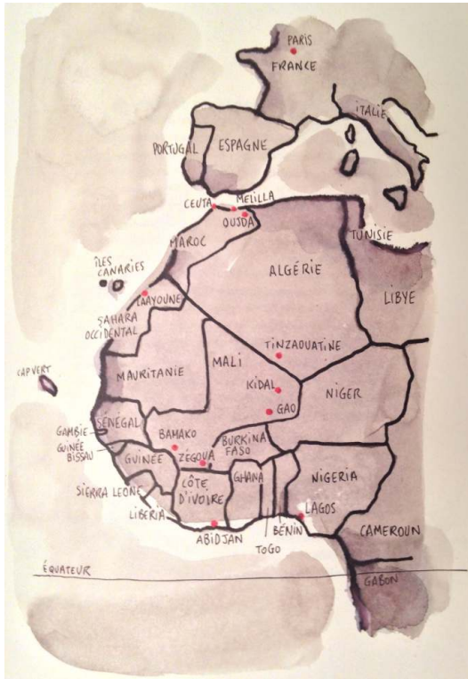
Illustration n° 3 : D'Abidjan à Paris, le parcours migratoire d'Alpha.

Extrait de : Bessora (auteur) ; Barroux (illustrateur) (2014) Alpha, Abidjan-Gare du Nord , Paris, Gallimard.