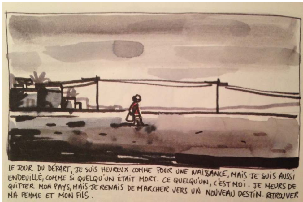
Illustration n° 2 : Le jour du départ d'Alpha.

Extrait de : Bessora (auteur) ; Barroux (illustrateur) (2014) Alpha, Abidjan-Gare du Nord , Paris, Gallimard.