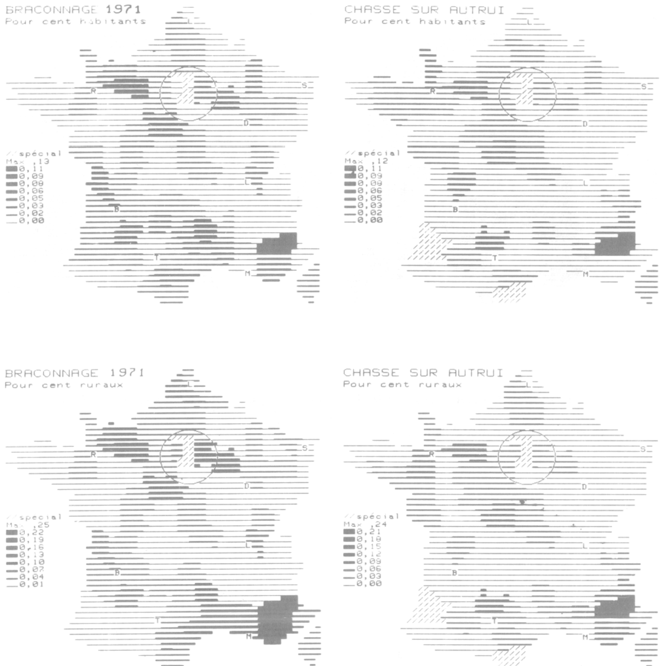
Fig. 2. Taux de «braconnage» et de chasse sur autrui en France en 1971. Sous le terme de «braconnage» on a regroupé les délits suivants : chasse sans permis, de nuit, avec des engins et en temps prohibés, les infractions aux cahiers de charge des sociétés de chasse. (Sources : recensement INSEE 1975, Office national de la chasse).