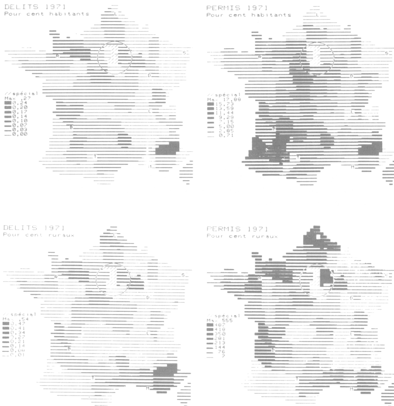
Fig. 1. Taux de permis et de délits de chasse en France en 1971. (Sources : recensement INSEE 1975, Office national de la chasse, 1971 ; on n'a pas retenu, pour les délits de chasse, l'année du recensement, les données étant incomplètes.)