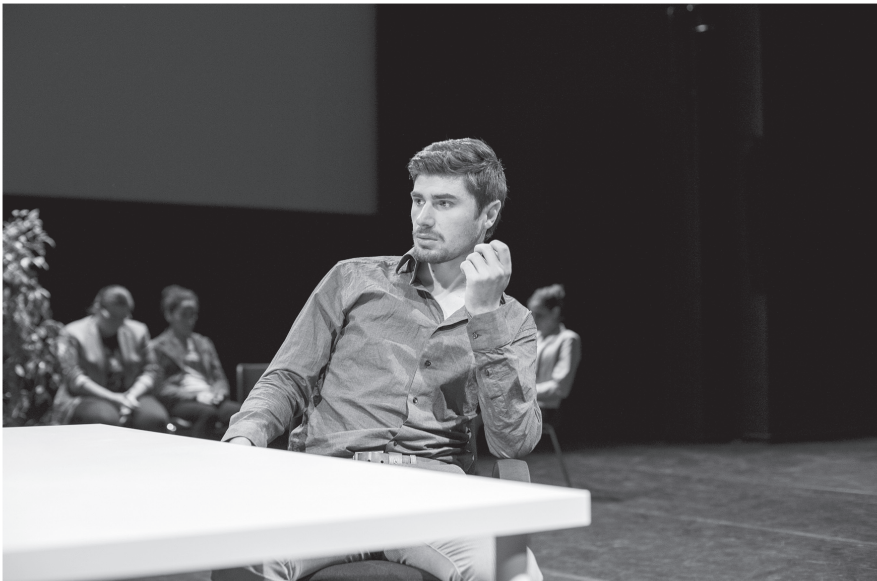
État civil , Théâtre du Bois de l'Aune