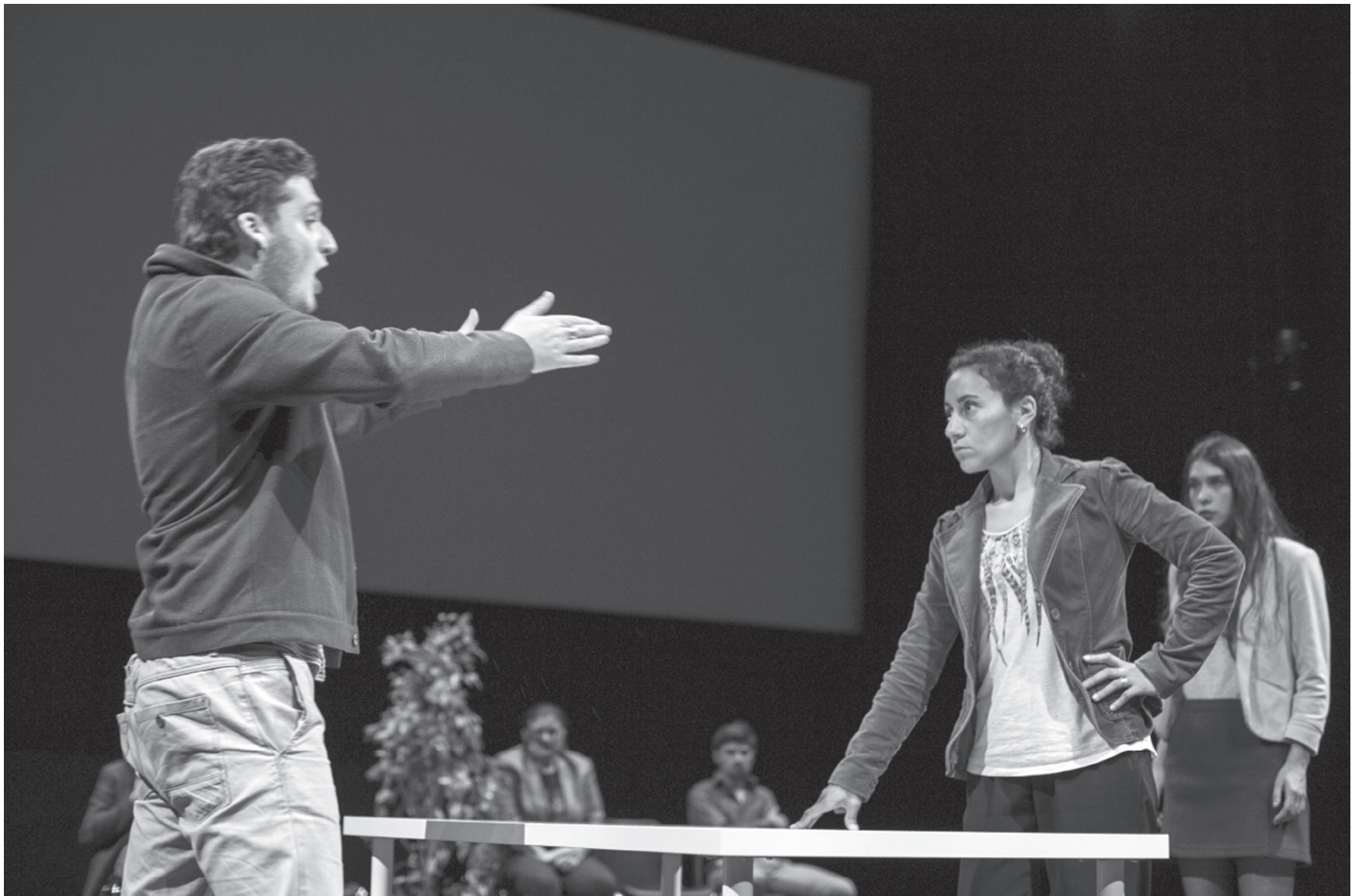
État civil , Théâtre du Bois de l'Aune, crédits photographiques Maxine Decker .....