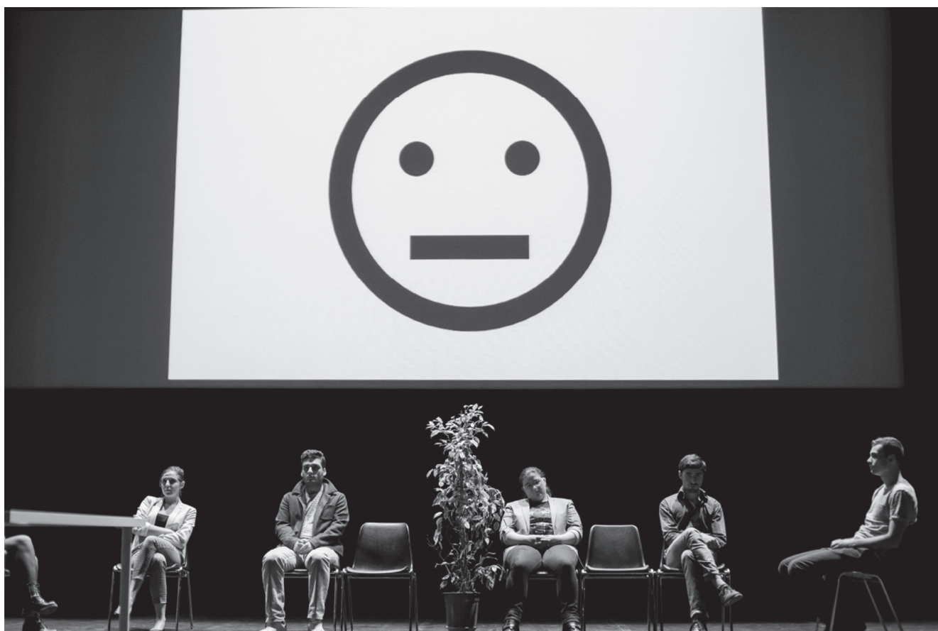
État civil , Théâtre du Bois de l'Aune, crédits photographiques Maxine Decker .....

Sous ces impulsions, l'auteur agence donc un drame objectiviste de papiers qui privilégie la chose vue, le détail révélateur et l'affinité avec le documentaire, mais aussi les traces de l'expérience physique, optique et sensorielle de son séjour dans les services municipaux. La vertu de ce texte, c'est toujours un certain regard, un objectif (pour employer un terme de photographie) qui, dans le détail le plus banal, dans le microcosme quotidien, découvre toute une situation historique et pointe quelques-uns des malaises symptomatiques de notre présent.