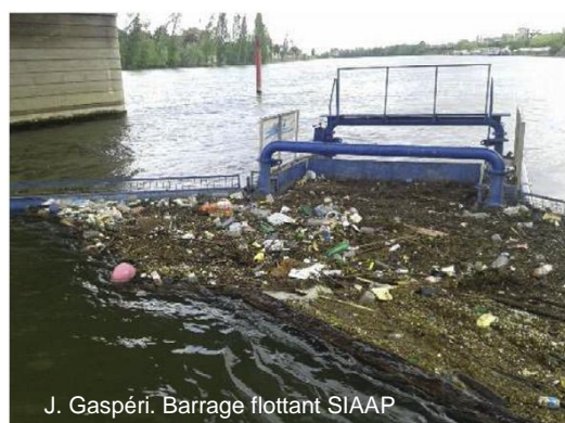
J. Gaspéri. Barrage flottant SIAAP

De manière plus spécifique, les recueils de données issus des refus de dégrillage des stations d'épuration, des barrages ou des écluses peuvent être exploités pour estimer des flux de déchets et constituent de réelles informations de terrain. En complément, des dispositifs de piégeage (cf. photo ci-contre) sont parfois mis en place pour capter une partie du flux de déchets dans différents compartiments du fleuve (surface, colonne d'eau, fond de rivière). Le flux capté est extrapolé en fonction du volume d'eau ou de section en eau. Ici, on considère que le flux de déchets est homogène dans l'espace et dans le temps, si le dispositif n'est que ponctuel. Or, ces approximations sont discutables et l'efficacité des pièges dépendante du débit des conditions hydrologiques.